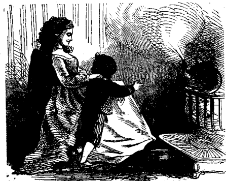
ՅՂ ԱՅԻՆ ԿԵՆԱՆԵՐԸ ՉՈՐՍ ՉՈՐԲԸ ԿԵՆԵ

Շատ իմաստուն մարդիկ այս կենաց վրայ դրած ատեն, անոր կարճութիւնը բացատրելու համար այլ և այլ բազմաթիւ հոգեբանական գործեր հարկ տեսնելով, որոնց մէջ ևս արագընթաց նաև մը կը նմանի, ըսած են: Նոյնպէս կենանքը նմանցուցած են որսին վրայ խոյացող արծուոյ մը, կամ աղեղէնջ ելած նետի մը որոյ թռչելը մարդ չկրնար տեսնել: Նաև կենանքը ծաղիկ մ'է որ արևն իր վրայ եկածին պէս կը թառամի: Կենանքն անձրևի ատեն երեցած ծիածան, ձմերային ամպոյ մէջ արեւուն մէկ պայծառ նշույլը, ստուեր մը, երազ մը, լեռան մը կողմէն վար վազող հեղեղ մը, պղպղակ մը, դիշերոյ վերջին ժամն է ըսած են: Եթէ կենանքն այսպիսի կարճ է որ իմաստուն մարդիկ այսպիսի նմանութիւններ կը գործածեն անոր կարճութիւնը ցուցնելու, դուք տղայք, պատրաստ եղէք ուրեմն այս կենաց վախճանին, և ջանացէք Աստուծոյ տղոց վայելուչ կերպով ապրել որ, երբ այս կենանքը լինայ, իրենց տունը վերադարձող տղոյ պէս երթաք ձեր երկնաւոր Հօրը: