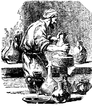
Բ Ա Ռ Ի Տ Ը

Գիտցիր որ քեզ փրկողը Քրիստոս է, ոչ թէ քու պնդով յարելը անոր : Քրիստոսով ունեցած ուրախութիւնդ չէ քեզ փրկողը . Քրիստոսի վրայ ունեցած հաւատքդ ալ թէ քեզ փրկելու միջոց է, բայց փրկող չէ, փրկողն է Քրիստոսի արիւնն ու արժանաւորութիւնը : Ուստի մի նայիր Քրիստոսի յարելու համար ըրած գործքերուդ, այլ նայէ Քրիստոսի, հաւատքիդ առաջնորդին ու կատարողին : Երջանկութիւն բնաւ պիտի չդանենք մեր աղօթքներուն, գործքերուն և մեր զգացումներուն նայելով : Քրիստոս է որ մեր հոգիներուն հանգիստ կուտայ, ոչ թէ քեզ : Թող քու յոյսերդ ու երկիւղներդ բոլոր մը զքեզ Յիսուսէն չհեռացնեն : Ան է ամէնը ամէն բանի մէջ . գնա անոր ետեւէն, և ան քեզ բնաւ պիտի չթողու :