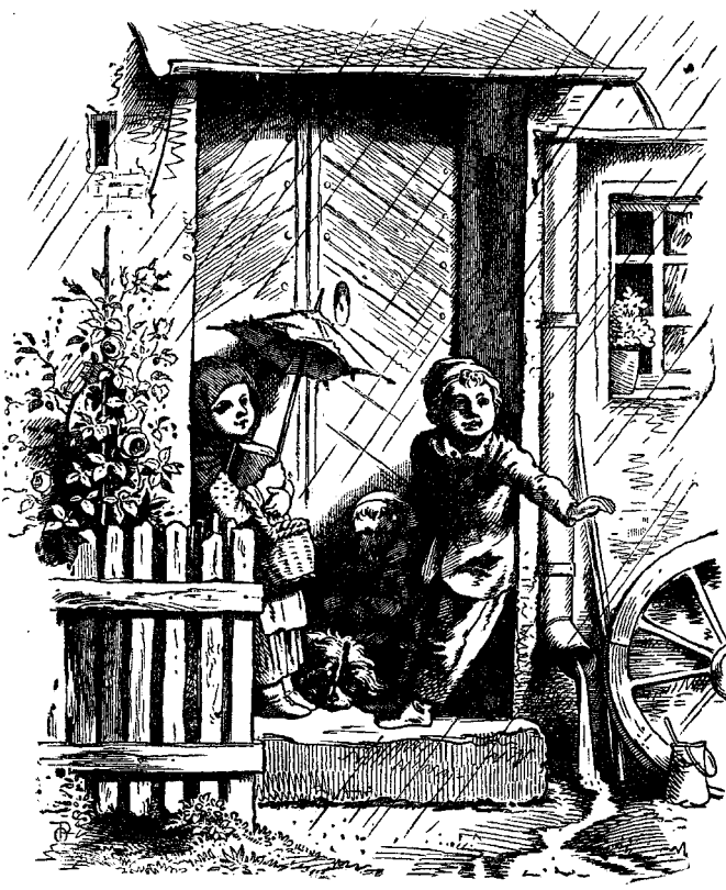
ԱՍՏԻԿ ԱՂԱՅԻՆ ԳԻՍՆ ԱՈՂՅԻ ԳԱՅԻՆ ԿԵՅԱՆ

Տղայքը գիտէք ինչ կը նշանակէ այս պատմութիւնը: Գիտէք այն մատանին լուս կը նմանի: Չէր ուզեր ունենալ այնպիսի դանձ մը որ զձեզ սիրելի ընծայէ ամենուն: Մատանին «էք է: Ով որ աւելի կը սիրէ զԱստուծամ և զմարդիկ, աւելի կը սիրուի անոնցմէ: