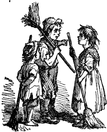
ԱՅՍՊԷՍ ԿԸ ՀԱՅՅՈՒՅՅԵՆ ԻՐԵՆՑ ԱՊՐՈՒՍՏԸ