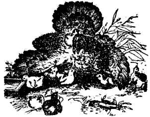
ԿՈՐՍՈՒԱՍ ԶԱՒԵ ԽՈՒՍԲ ՄԸ ԶԱԳԵՐ ԿԸ ՆԱՅԵՐ

Էֆթիք հանրմ կը կասկածէր թէ Ստեփան գողցաւ հաւն և տարաւ իր մօրը, որ շատ աղքատ և ծեր կ'ին մ'էր ու բլուրին վրայի գիւղը կը բնակէր: Ստեփան բաւական աղէկ տղայ էր, հաւ և ուրիշ բան ամենին չէր գողնար. խեղճ տղան շատ տակն ու վրայ եղած էր որ Էֆթիք հանրմ զինքը գողի տեղ կը դնէր: «Ասկէ պիտի ելեմ երթամ» ըսաւ օր մը Ագապի հանրմին, որ դբացիներէն մէկն էր: «Ո՞ր պիտի երթաս», ըսաւ անոր Ագապի հանրմ: «Ուր ալ ըլլայ պիտի երթամ հոգս չէ, այլևս չեմ կրնար մնալ այնպիսի տան մը մէջ ուր զիս գող կը բռնեն» ըսաւ Ստեփան: «Ճամբու ծախքի համար ստակ և անցագիր ուսիլց պիտի առնես», հարցուց անոր Ագապի հանրմ: «Առանց ստակի պիտի երթամ» ըսաւ Ստեփան: «Ո՞չ, չես կրնար երթալ», ըսաւ Ագապի հանրմ. «մանաւանդ ըրածդ խենդութիւն է: Համբերելու ես մինչև որ ապացուցանես թէ դուն գող չես» «Բայց չեմ կրնար ապացուցանել» ըսաւ Ստեփան. «Էֆթիք հանրմ կը կարծէ թէ ես գող եմ. ի՞նչ կրնամ ընել անոր: Ես կը կարծեմ որ հաւն