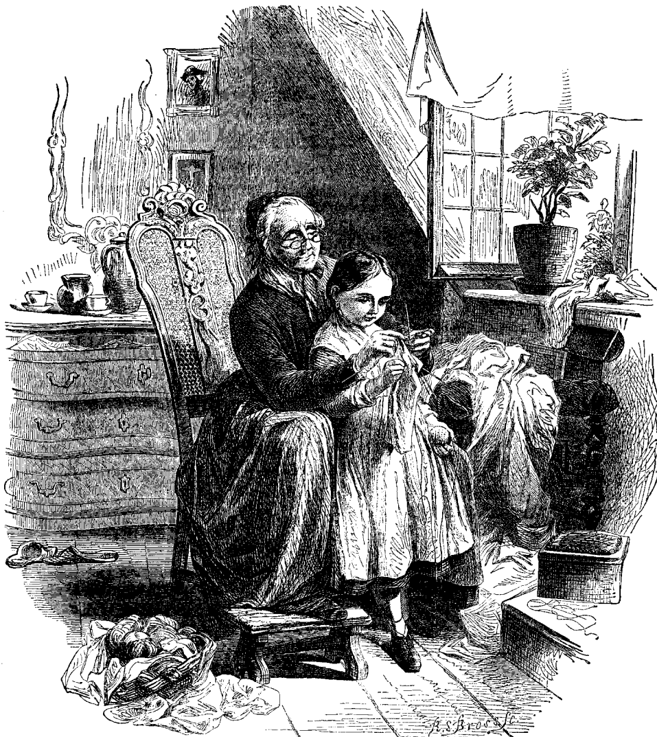
ԱՆՈՐ ՅՈՒՅՈՒՅ ԹԷ ԻՆՉՊԷՍ ԲՈՆԵԼՈՒ Է

անոր ցուցուց թէ ասեղները ինչպէս բռնելու է, և փոքր խրատ մը տուաւ անոր : «Ես ալ տպագրապետին պիտի ըսեմ որ այն խրատը տպէ, որպէս զի բոլոր տղայք կարենան զայն կարգաւ : Հաճի խաթուն Սըբուհին ըսաւ . «Գժուար է, բայց այս աշխարհի մէջ օգտակար բան մը չկայ որ առանց դժուարութեան եղած ըլլայ : Եթէ ատաղձագործք շատ չաշխատէին, մեր ասուները ոչ պատուհան և ոչ դուռ կ'ունենային . եթէ որմնագիրները շատ չաշխատէին, մեր ասուներուն պատերը չէին շինուեր : Եթէ հացագործը շատ չաշխատի, դուռն ուտելու հաց չես կրնար գտնել : Եթէ աղօրէպանը շատ չաշխատի, հաց չինելու ալիւր չգտնուիր : Եթէ երկրագործը շատ չաշխատի, ալիւր աղալու ցորեն չգրանուիր : Եթէ քու հայրդ ու մայրդ շատ չաշխատին, հաց և տուն չինող մարդոց տալու ստակ չի գտնուիր : Գործք ծանր ըլլալուն համար մի դադրեցներ զայն, այլ քաջ եղիր, և յարասէ : Այն ատեն ազէկ կրնաս ընել ինչ որ ընել կ'ուզես : »