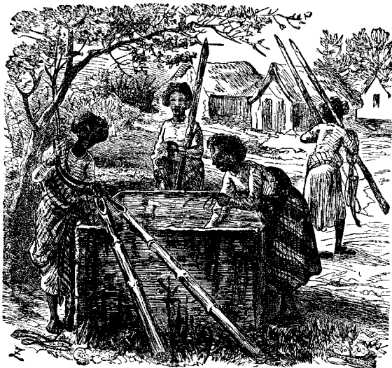
ԵՆԵԳՆԵՐՈՎ ԶՈՒՐ ԿՐԵԼԸ