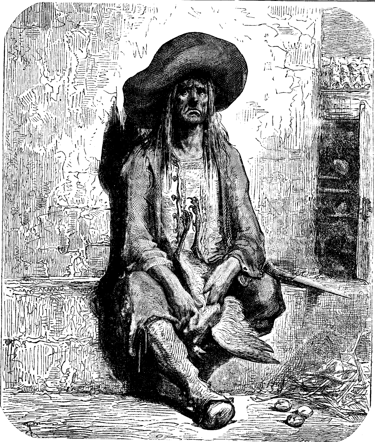
«ԱԻՆԸ, ՀԱՐԻՆ ՓՈՐԻՆ ՄԷՋ ՈՍԿԻ ԶԿԱՐ»