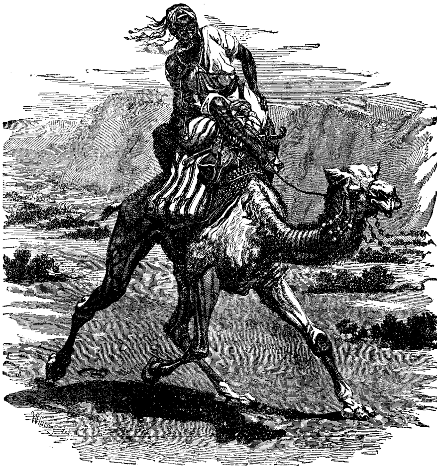
ՈՒՂՏԸ ՏԱՏ ԱՐԱԿ ԿԵՐՔԱՅ