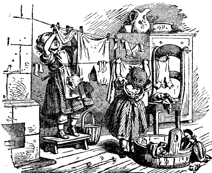
ԱՌՈՒՒ ՎՐՈՅ ԶՈՒՆՑ ՄԸ ԿՊՈՅՈՒՆ

«Ինձի ես կ'իշխեմ,» կ'ըսէր խորիւտարով երիտասարդ մը, երբ բարեկամ մը կը ջանար համոզել զանի ետ կենալ այս ինչ գործէն: Բարեկամն անոր հարցուց. «Գիտե՞ս, ինչ ծանր պատասխանատուութիւն կ'առնես, ինձի ես կ'իշխեմ» ըսելով: «Պատասխանատուութիւն կ'առնեմ վրաս, այն պէն է,» ըսաւ երիտասարդը: «Ինք իրեն իշխել ուզողը,» կրկնեց բարեկամը, «լաւ տեղեակ ըլլալու է ամէն գործի, և գիտնալու է թէ շիտակ է գործը: Ապա աշխատելու է ամենէն աղէկ միջոցները գործածել որպէս զի կարենայ աղէկ վախճանի մը հասնիլ: Ամէն պատահար և արգելք զգուշութեամբ հաշուելու է, և ջանալու է միշտ որ ամէն բան օրինաւոր ըլլայ, ապա թէ ոչ գործը չի յաջողիր:» «Եւ ետքը,» ըսաւ երիտասարդը: Բարեկամը յառաջ տարաւ խօսքը ըսելով. «Կ'ըսես թէ, ինձի ես կ'իշխեմ»: Բայց միթէ խիղճդ մաքուր, սիրտդ բարի, բարքդ լաւ, կամքդ ուղիղ և դատողութիւնդ կիրթ է. եթէ այսպէս չէ, ոչ թէ դուն, այլ ասոնք կ'իշխեն քեզի:» «Խօսքդ շատ ճշմարիտ է,» ըսաւ երիտասարդը: «Որովհետեւ այս բաները կը պահանջուին,» ըսաւ բարեկամը, «եթէ ես քու տեղդ ըլլայի, ես ինձի իշխել չէի ուզեր, և եթէ ուզէի, անտարակոյս պիտի չյաջողէի: Սառուղ ուզեց ինք իրեն իշխել, և չկրցաւ. Հերովդէս ալ ուզեց, չկրցաւ, Յուդա ալ ուզեց, չկրցաւ. և ուրիշ ով որ ուզէ պիտի չկրցայ: Մենք մեզի իշխու ունինք գրքիստոս, անոր առաջնորդութեամբ գործելու ենք: Ան իշխելու է մեզի, և եթէ ան կ'իշխէ, ամէն բան կը յաջողի:» Երիտասարդը սկսաւ մեզմով և մտածելով ըսել սա խօսքերը. «Մենք մեզի իշխան ունինք գրքիստոս. ով որ անկեղծութեամբ անոր առաջնորդութեանը կը հետեւի, պիտի յաջողի:»