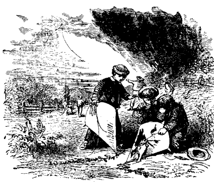
ՊԱՏՈՍԱԹ ԹՐՈՒԹԻՎԸ ԱՐՏԱՍՈՒՔ

ԿՈՍՏԱՆԴՆՈՒՊՈԼԻՍ ՏՊԱԳՐՈՒԹԻՒՆ Ա. ՅԱԿՈՐ ՊՅԵԱՅԱՆ