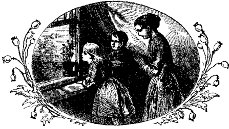
ՅՂԱՅԻՔ ԵՐԿԵՆԻՔ ԿԸՆՍՈՒՆ

կը նշմարուի երկինքը : Երբ գիշերնե- րը երկինք կը նայինք, տեղ տեղ եր- կու կամ երեք աստղ միայն կը տես- նենք . բայց երբ այն տեղերը դիտա- կով կը նայինք, կը տեսնենք գունդ- գունդ աստղեր : Նոյնպէս դիտակով կը տեսնենք որ աստղերէն ոմանք կըը- կին են, այսինքն իրարու գրեթէ կից երկու աստղ են : Գարձեալ աստղերը գոյնզոյն են . ոմանք կանանչ են, ո- մանք մանուշակագոյն, այլք կապոյտ : Կան նաև որ կարծիր կամ ուրիշ գու- նով են : Աստեղագէտք աստղերէն շատերը հասարակած աստղ կ'անուանեն : Կան քանի մը աստղեր որ մեր երկրին պէս արեգական բոլորտիքը շրջան կ'ը- նեն : Ասոնք հաւր կը կոչուին : Այն աստղերը որ շողշողուն կ'երևին հաս- տատուն աստղեր են : Եթէ ուշադրու- թեամբ դիտէք, պիտի տեսնէք որ աստղերէն ոմանց լոյսը շողշողուն չէ, այսինքն չերեբար . այս աստեղք մե- լորակ են, բայց առանց դիտակի նա- յելով երկու կամ երեք մոլորակ հա- զիւ կրնանք տեսնել :