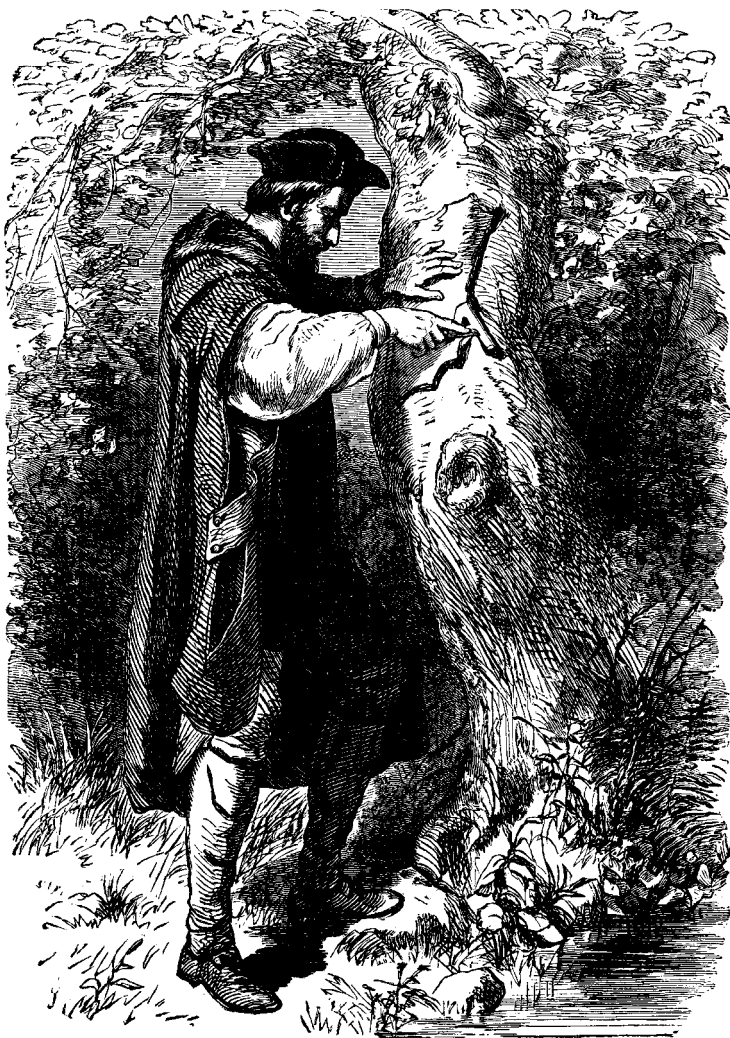
ԳՈՒԳԻՆ ԱՆՏԱՐԻ ՄԷՋ