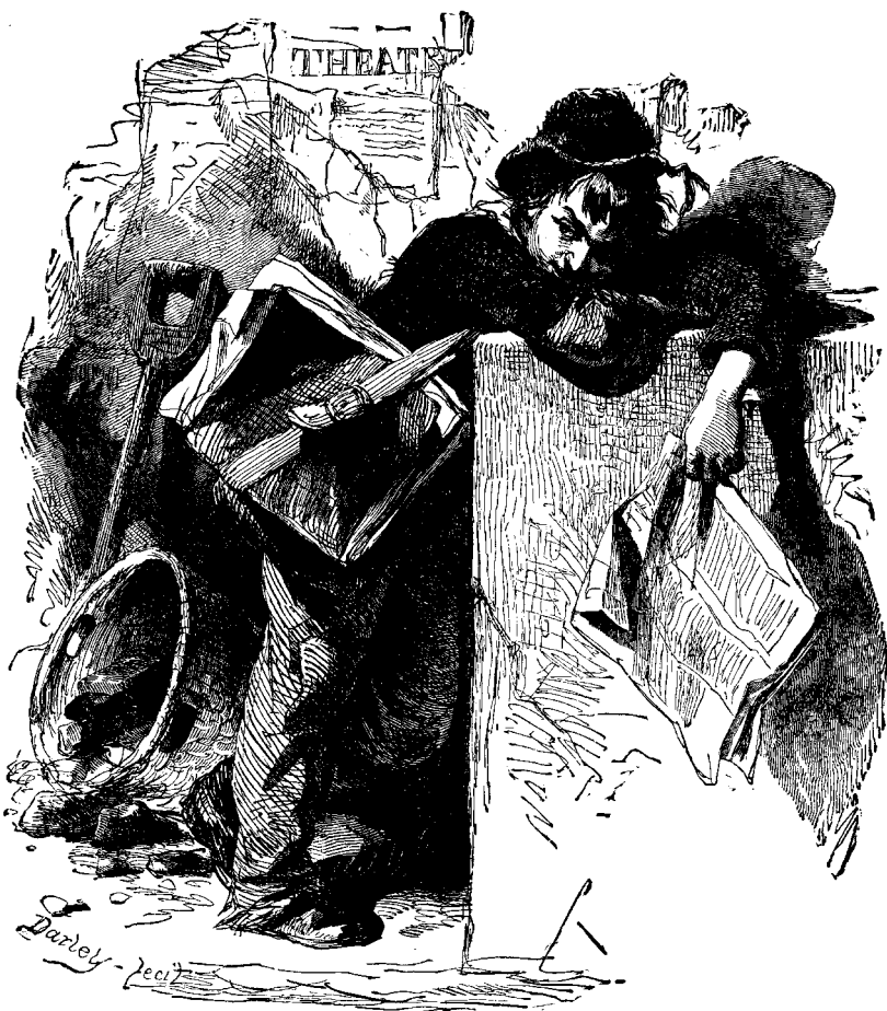
ՅՈՒՆ ՏՂՈՅ ՄԸ