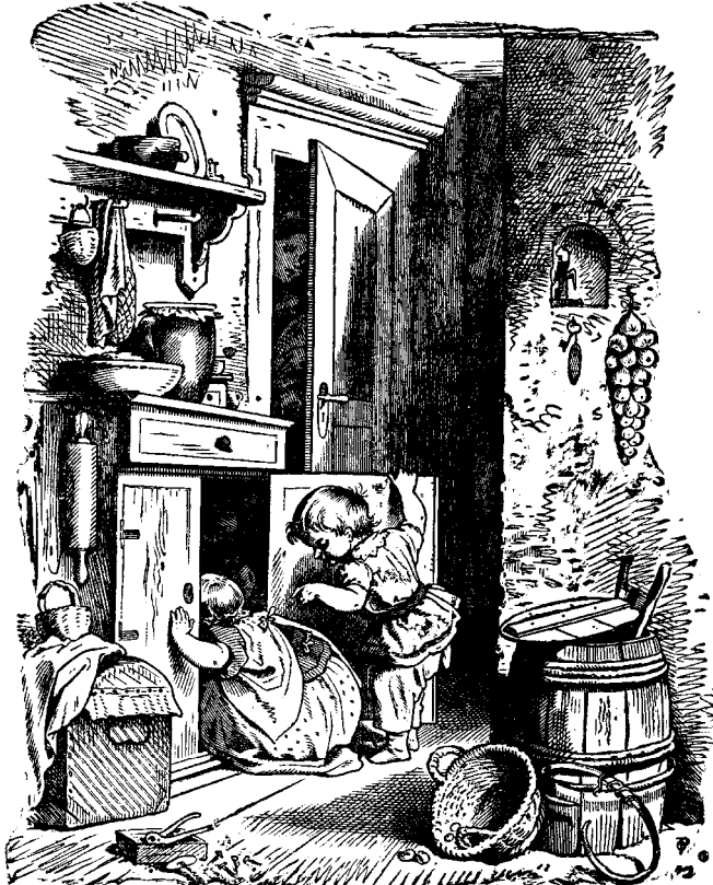
ՎԵՐՉՈՒՅԻՆ ՀԱՅՐ ԳՏԱՆ ԳՈՐԾՈՒՆ ՄԷՋ

Հայրը երկրորդ որդւոյն պատասխանին ալ չհասնելով ըսաւ. «Յիմար տղայ, այսպէս ընելով ցորենը կորուսիր: Յորեն և ստակ օգտակար կեր-