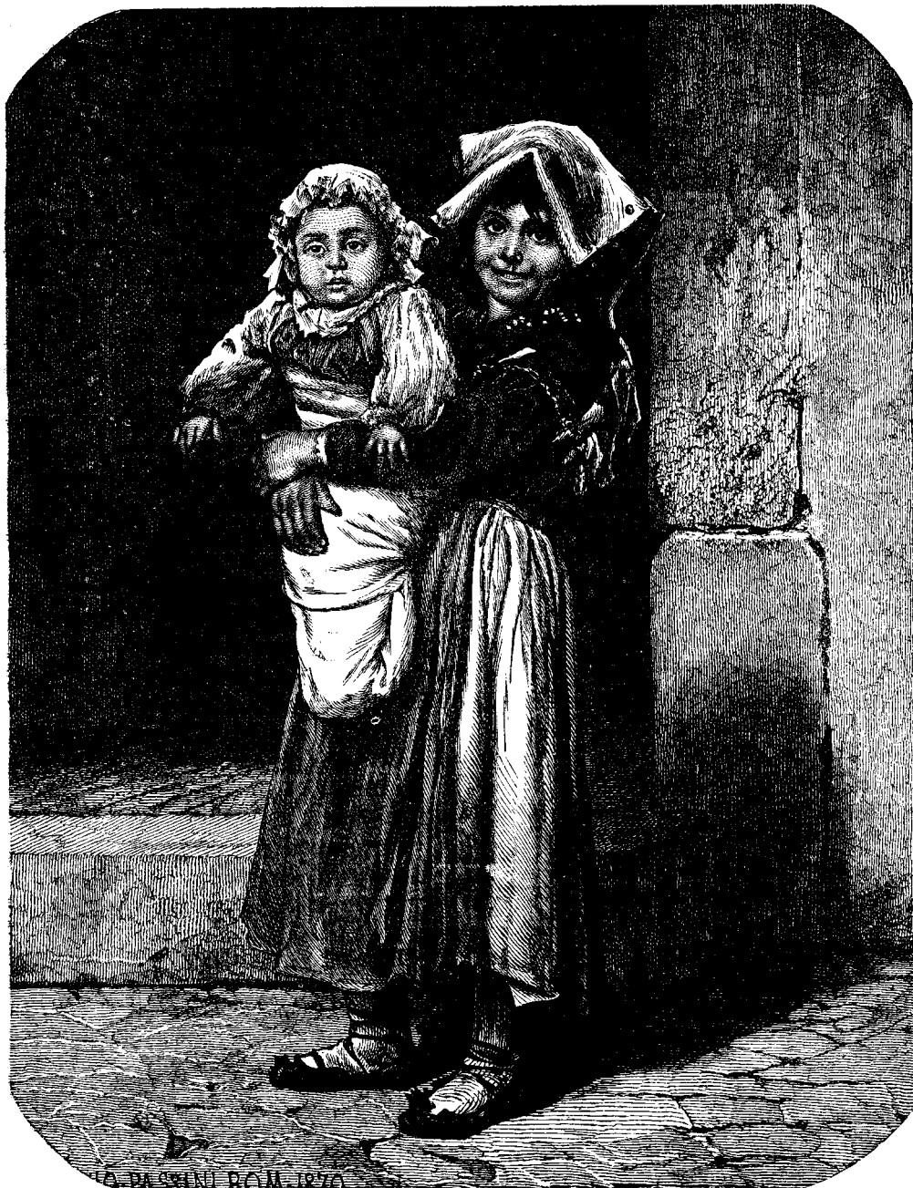
Ի Տ Ա Լ Ա Յ Ի Ք ԱՂՋԻԿ ՄԸ

Քանի մը տարի առօջ իտալիա փոքր տէրութեանց բաժնուած էր, բայց 1859ին, 1860ին և 1866ին այլ և այլ պատերազմներէ ետքը այն փոքր տէրութիւնները վերցան, 1870ին նաեւ Հռովմ Պապէն հանուեցաւ, և բոլոր իտալիա միացաւ վիզդոր Էմմանուէլի թագաւորութեան ներքեւ : Հիմա իտալիա իբր 30,000,000 բնակիչ ունի :