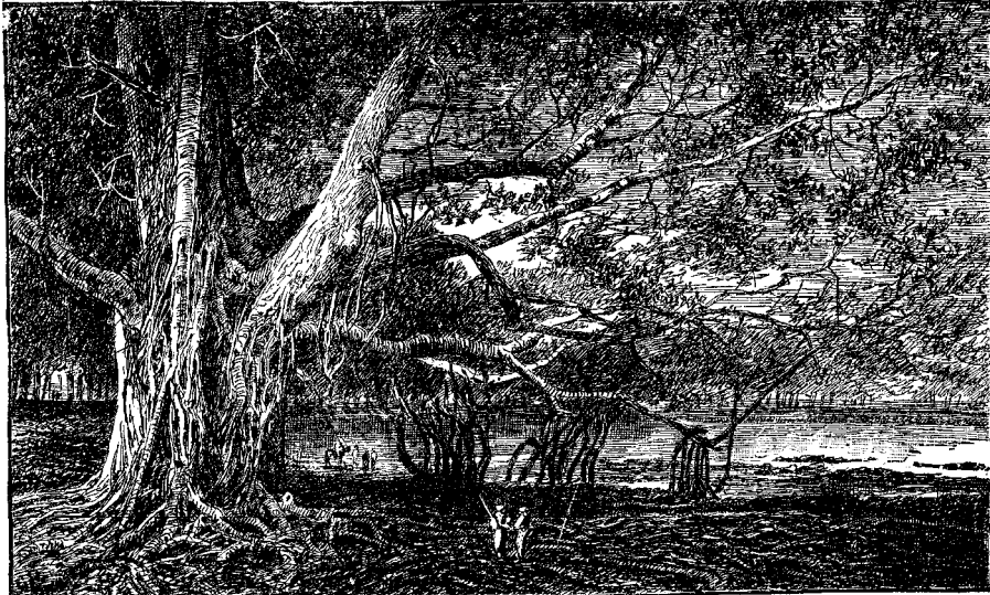
ՊԱՆԵԱՆ ԿՈՉՈՒՄԾ ԵՄՈՐԸ

Անոնք որ Հին Կտակարանը կը կարդան , գիտեն թէ խրայէլի որդիք սովորութիւն ունէին որոշեալ օրեր յատուկ շնորհակալութիւն մատուցանել Աստուծոյ անոր ողորմութեանց համար : Այս սովորութիւնը գեոկայ Քրիստոնեայ ժողովրդոց մէջ : Ամերիկայի մէջ Նոր Անգլիայի բնակիչք Ամերիկա հաստատուելէն ի վեր սովորութիւն ըրած են այնան մէջ օր մը յատուկ շնորհակալութեան օր ընել , և այն օր որդիք և թառուք սովորաբար կը խմբուին իրենց ծնողաց կամ հաւուց տաներն , և այլևայլ եկեղեցիներու մէջ կրօնական պաշտամանց ներկայ գտնուելէ ետքը , օրը կ'անցունեն միաբան ուրախութեամբ և շնորհակալութեամբ : Այս սովորութիւնը փայելուց և գեղեցիկ սովորութիւն է , և հետզհետէ ընդհանուր կ'ըլլայ բոլոր Միացեալ Նահանգաց մէջ : Մենք ամէնքս Աստուծոյ ընդունած ենք շատ պարզ կենք որոյ համար պարտինք շնորհակալ ըլլալ մեր երկնաւոր Հօր ա՛ն՛ն ա՛ն՛ն : Ոմանք որ շատ քիչ մասն ունին աշխարհային հարստութենէ և ճոխութենէ , թերևս կը կարծեն թէ քիչ բան ունին որոյ