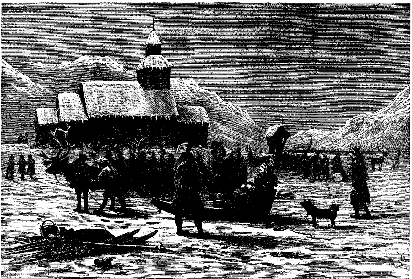
ԵԿԵՂԵՑԻ ՄԸ Ի ԼԱՐՈՆՈՍ