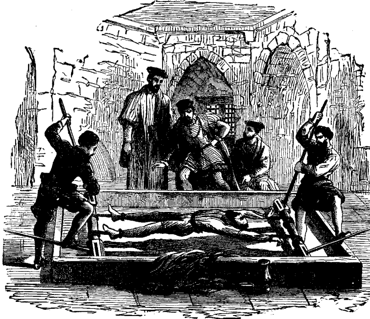
ՀՄԱՅՆԻ ՀԱՄԱՐ ՏԵՆՅԱՐ

Վերջապէս հասաւ ականակիտ վրտակի մը գլուխ, որ անտառին մէջ կը հոսէր հեղիկ, և որովհետև ծառաւի էր, հոն կանգ առաւ շուր խմելու: Բայց ճիշտ այս վայրկեանն յանկարծ ետևի կողմէն մէկը բռնեց զայն, Տիքի աչքը բացաւ և դտաւ զինք բարձրահասակ հսկայի մը ձեռք, որ շատ մեծ էր քան զինք: Հսկայն յոյժ ու-