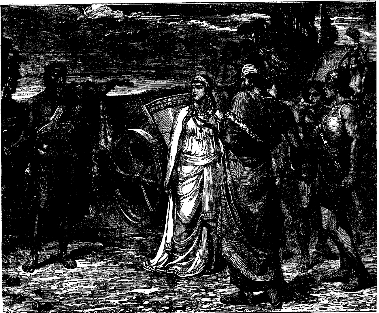
ՆԴՐԱ ՅՆՁԱՐԷԻ ԱՌՋՆԻ ԿՅՈՒՆ