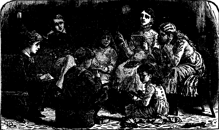
Տղայք որ բաւերու խաղ կը խաղան

1 թուանչանը , վասն զի Եւնիկէի ցանկին մէջ չկայ այն բառը : Սիմոնի ցանկը ընկաւ : Հիմա Մարիամին կը հարցուի թէ իւր ցանկին մէջ կայ բառ մը որ չգտնուիր Սիմոնի ցանկին մէջ : Մարիամի ցանկին մէջ կայ կոթ բառը որ կայ նաև Եւնիկէի ցանկին մէջ , բայց չկայ Սիմոնի ցանկին մէջ , ուստի այն բառին առջև կը գրուի 1 թուանչանը : Մարիամին ցանկն ևս ընկաւ , բայց Եւնիկէ կ'ըսէ թէ իւր ցանկին մէջ կայ բառ մը որ նշանակուած չէ ոչ Սիմոնի և ոչ Մարիամի ցանկին մէջ , և այս բառն է կոթ , և Եւնիկէ կը խորհի թէ իրաւունք ունի այն բառին առջև դնել 2 թուանչանը , վասն զի Սիմոն և Մարիամ չունին այն բառն իրենց ցանկին մէջ : Բայց Սիմոն կը գոչէ , «Ոչ , ոչ , Մարիամ և ես կը չահինք մէկ մէկ թիւ , վասն զի կոթ բառին մէջ կայ գրիչ , որ չկայ կոթի բառին մէջ » : Այսպէս Սիմոն և Մարիամ իրենց շահած թուանչաններուն վրայ կ'աւելցունեն 1 թուանչանն , և Եւնիկէի ցանկին մէջ կոթ բառը կը մնայ առանց թուանչանի , և այս կը ցուցնէ թէ այն բառը սխալ է իւրաքանչիւր իւր