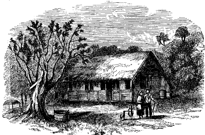
ՅՈՒ ԱՏԱՄԹԻ ՏՈՒՆՑ

բաց նաւակի մը մէջ տարով անոնց քիչ մը պաշար : Զարմանալի էր որ անոնք ապահովապէս ճանապարհորդելէ ետքը օվկիանոսին վրայ հարկուոր մղաներով՝ հասան մարդարձակ