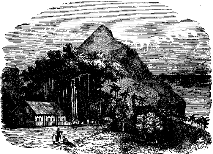
ԵՆՈՂՆԵՆԻ ԵՒ ԳՊՈՐԻ ՇԵՊԵՐ

տարին դաշեցով փայտաւոր՝ կ'իման, և սակայն երբ կուգայ անոնց հայրը տուն, և կը ցուցնէ զայն անոնց, տըղաքը կ'ըսեն թէ չաեսան զայն անկէ առաջ, թէպէտ թերևս քսան անգամ անցած դարձած էին անոր վրայէն: Ի՞նչ է այս բանին պատճառը: Կարծեմ միտքն է որ չէ տեսած և չիշէր: Այս աղայք ու չարութիւն չեն տար, և շատ ցաւալի է որ այսպէս կ'ընեն: Երբեմն ու չարութիւն չընելու և անհոգութեան այս ունակութիւնն այնպէս հաստատուած կ'ըլլայ որ վնասուց պատճառ կ'ըլլայ անոնց բոլոր կենաց մէջ, պատճառ կ'ըլլայ անոնց ժամանակէն ժամեր կորսուելուն, և նեղութիւն է ամէն մարդու որ կ'ապրին կամ առնչութիւն ունին անոնց հետ: