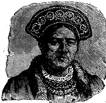
ՀԻՆ ԳՒԽԱՐԿԻ ՈՐՈՍ ՏԻԿԻՆ

Կը պատմուի ճորճ Սթիֆընսընի համար, որ եղաւ հնարիչ առաջին շոգեկառքին, թէ երբ էր երիտասարդ, օր մը ելաւ իւր ասն վերի յարկի սենեակը և գոցեց պատուհանը: Երկար ժամանակ բաց թողուած էր այն օդոյն սաստիկ տաքութեան պատճառաւ, բայց որովհետև այն ատեն օդը սկսած էր զովանալ, Սթիֆընսըն խոր-