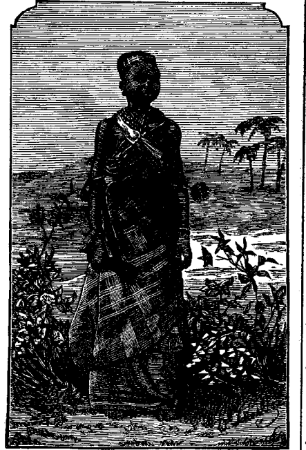
ՖԻՐԻՆԻ ՔՐՈՒՆԻ ՄԸ

Բայց Յիսուս ֆրիստոս տղին հետ է, վասն զի հանդարտ վստահութեամբ և որոշմամբ՝ որպէս զի չանարդէ իւր սիրելի Գիրքը, կը կենաց պողպատի պէս հաստատուն, և հաւատարիմ իւր Փրկչին և Տէրոջը, և թէպէտ մահ կը սպառնան անոր երեսին, կը պա-