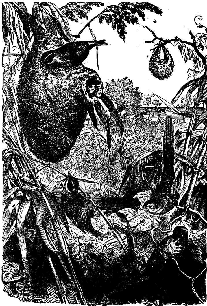
ԱՌԿԱՍԵԱՆ ԲՈՅՆ ՇԻՆՈՂ ԹՈՉՈՒՆՔ

հոն , եկեղեցւոյն հովիւր մօտեցաւ անոր , և հարցունելով անոր հասկցաւ թէ տղան ևս կ'ուզէր ընդունուիլ եկեղեցւոյ հաղորդութեանը : Վասն որոյ ըսուեցաւ անոր նստել , և սկսաւ քնննութիւնը : Քննութիւնն յառաջ գնաց գոհացուցիչ կերպով մինչև սոփրական հարցմանց մեծագոյն մասն հարցուեցաւ , տղան պարզ կերպով և հեշտութեամբ պատմեց պարագաները որոց միջոցաւ արթնցած էր զգալ իւր