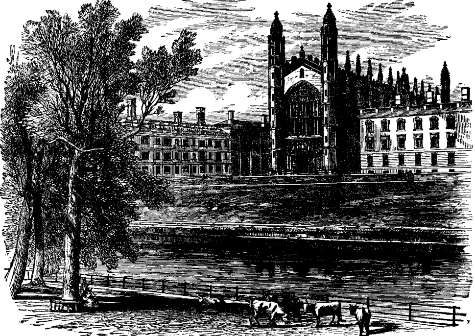
ԱՐՔՈՒՆԻ ՔՈՒԷՃ Ի ՔԷՅՄՊՐԻՃ

նէին օրերն իրարու ետէ, և տակաւին Պոպի կ'երթար ետ գերեզման ուր տեսած էր թէ յուղարկաւորք դրին իւր տէրը: Ամիսներ անցան և տարիներ ևս, և տակաւին Պոպի կը յիշէր իւր տիրոջ գերեզմանը: Եղաւ ընտանի և սիրելի քաղաքին այն կողմը: Հուսկ յետոյ 1872ին, անոր տիրոջ մահուանէն տասնևչորս տարի ետքը, մեռաւ և Պոպի, մինչև ի վախճան հաւատարիմ ըլլալով յիշատակին և սիրոյն որ սպաւորուած էր անոր փոքրիկ թաւամազ գլխոյն մէջ: Օր մը Պոպի գրտնուեցաւ մեռած իւր տիրոջ գերեզմանին վրայ զոր հսկած էր հաւատարմութեամբ տասնևչորս տարի: