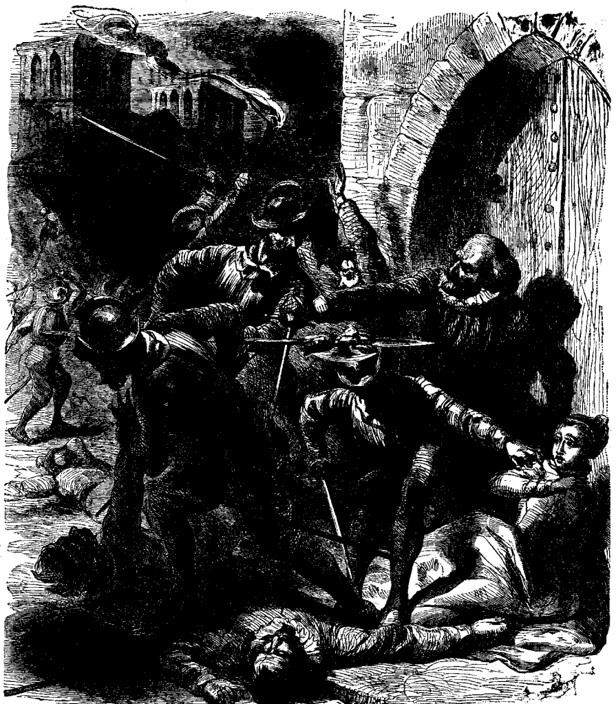
ՍՐ. ԲԱՐՈՂՈՂԱՄԵՆՈՒ ԿՈՏՈՐԱԾԸ

մին: Գաղիոյ այն ժամանակի թագաւորը, Կարողութեամբ, ստորագրեց հրովարտակ մը որ կը հրամայէր սպաննել Գաղիոյ մէջ գտնուող բոլոր Բողոքականները, և ընդհանուր կոտորածն սկսաւ նախ սպաննելով զԾովակալ Գոլիթի, Բողոքականաց զլուխը: Թագաւորին այսպիսի հրովարտակ մը կրնաքելու մասին պէտք է ըսել որ զնա համոզած էին թէ Բողոքականք դաւ կը նիւթէին անոր կեանքին դէմ, և թէ կոտորածին հրամանը տրուելէն ետքը, թագաւորն ուզեց ետ առնուլ զայն բայց կարող չեղաւ: Թագաւորին մայրը, Գաթմարին սը Մէտիչի, և Կիզի Դուքսն էին բուն հեղինակը այն ոճիրն: Սպաննեալ Բողոքականաց թիւը կը