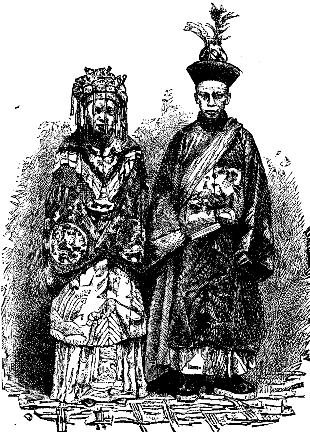
ՀԱՐՍՆ ԵՒ ՓԵՍԱՆ

նուհետև դիմեցին բաղդահմային և երբ սա բարի գուշակութիւններ ըրաւ կատարուելիք ամուսնական կապին վրայ, կարգադրուեցան հարսնիքին մանրամասն պայմանները: Բայց եթէ դժբաղդ համարուած դէպք մը պատահէր երկու ընտանեաց միոյն մէջ հարսանեաց հանդէսը տեղի ունենալէն առաջ, ետ-