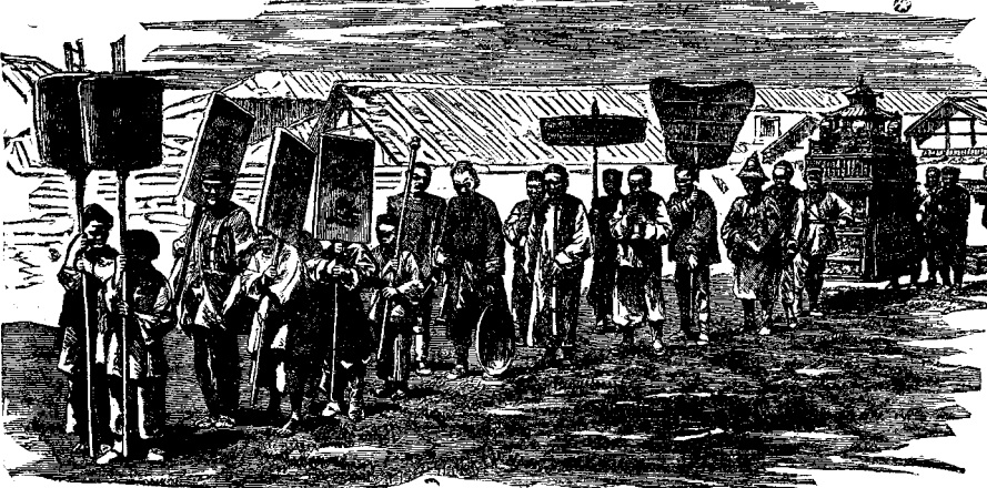
ԶԻՆԱՑ ՀԱՐՍԱՆԵՑ ՀԱՆՌԻՍԵՐԸ

Երբ եկաւ հարսանեաց օրը, հարսնացուն տարուեցաւ փեսայացուն տունը