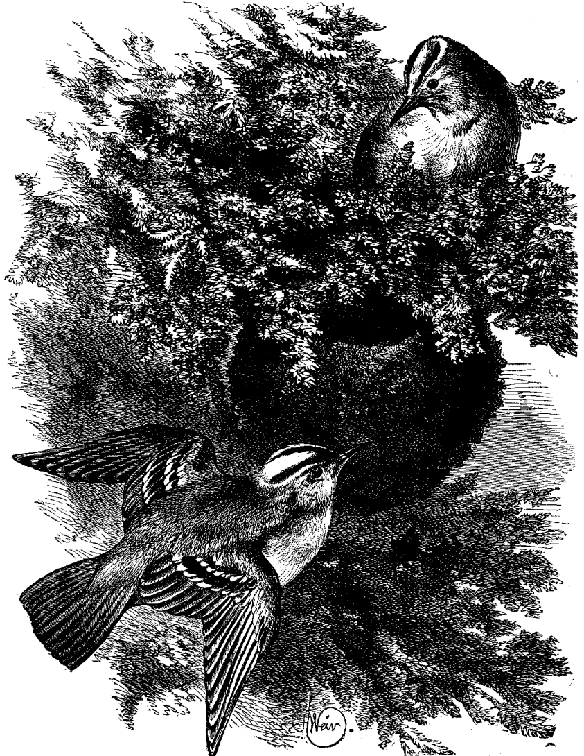
ԹՈՒՉՆՈՅ ՆՈՐ ԸՆՏԱՆՈՒԻ ՄԸ

ԿԷՍ ԽՆՁՈՐ, ՃՇՄԱՐԻՏ ՊԱՏԱՌԹԻՒՆ ՄԸ Ասկէ իբր երեսուն տարի առաջ ձմեռուան ցուրտ առաւօտուն խումբ մը աղջիկներ և մանչեր հաւաքուած էին դպրոցին սրահը կրակարանին շուրջը : Կը խօսէին և կը խնդային, քիչ ուշադրութիւն ընելով նորեկ աղջկան մը որ միւսներէն զատ կայնած էր : Ժամանակ ժամանակ կողմնակի հայուաց մը կը նետէին անոր կողմը կամ կը դառնային դէպի նա և աչքերնին յա-