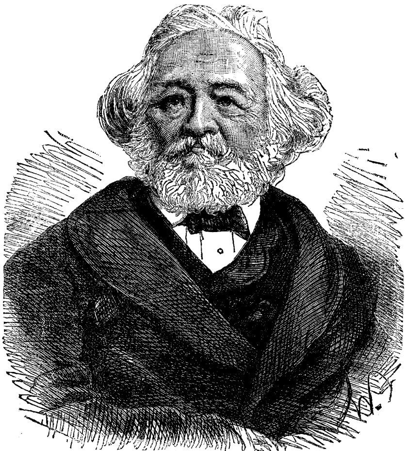
ՅՈՆ ՌԱՆՔԷ ՊԱՏՄԱԳԻՐԸ

Թերևս դիւրին երևի պատմութիւն գրելը. բայց զայն լաւ գրելու համար բարձր կարգի յատկութիւններ պէտք են: Առաջին կարգի պատմագիր մը պարտի ըլլալ աշխատասէր, որով կարող ըլլայ տարիներով գրադիլ քննելու հին ձեռագիրներ և արձանագրութիւններ. պարտի ունենալ զօրաւոր յիշողութիւն և ողջամիտ դատողութիւն, այնպէս որ կարող ըլլայ զատել սուտը ճշմարիտէն, և գտնել դէպքերուն ստոյգ պատճառները. երևակայութիւն՝ որով կարող ըլլայ պատկերացունել իւր միտաց մէջ անցեալ դարերու և ուրիշ երկիրներու տեսարանները. և հաճելի ոճ՝ որով կարողարու հրապուրէ իւր ընթերցողները: Ֆոն Ռանքէ մեզ ժամանակակից մեծագոյն պատմագրաց մին էր, վասն զի ունէր վերոյիշեալ յատկութիւնները: Անոր ամենէն հռչակաւոր գործն եղաւ վեպասաներորդ և եօթնասաներորդ դարուց Պապերուն պատմութիւնը: Գրեց նաև “Հինգ