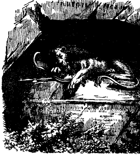
ՅԵՆԱՍԱՐԻՄ Ի ԶՈՒՅՐԻՄ

«Երբունի տիկին» և իւր փոքրիկ թուան հաւատքը այնպէս սրտաշարժ էր, կ'ըսէ տղային, «որ ես որոյնցի ամէն ջան ի գործ դնել զնա բժշկելու համար, և ժամանակ ետքը փոքրիկ տղան կարող եղաւ վազվազելու լաւ մը զօրացած ըլլալով իւր ընկե-