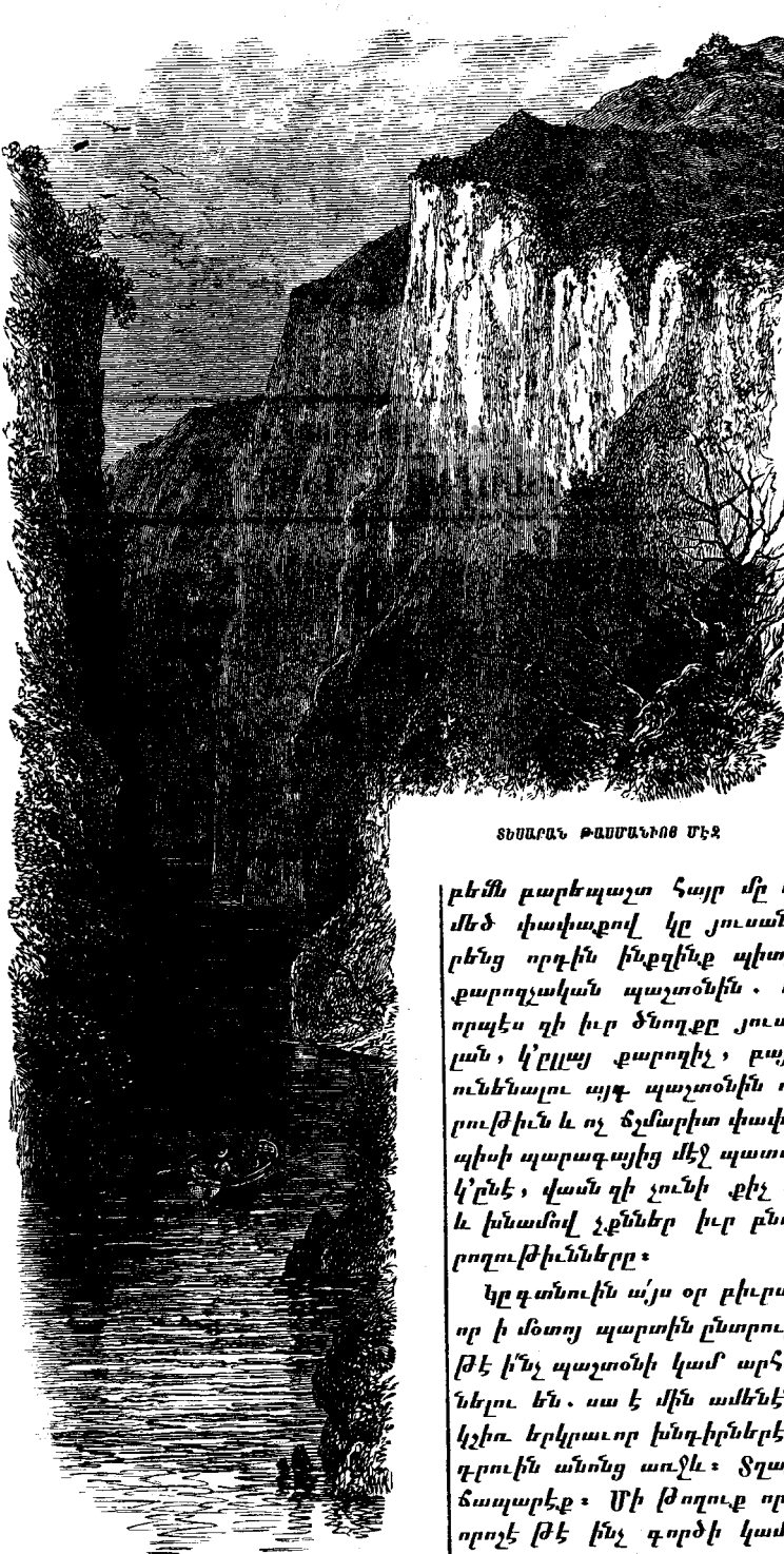
ՏԵՍԱՐԱՆ ԹԱՄԲԱՆՈՑ ՄԷՋ

որով պատուաւոր դիրք մը ստանայ : Դուք ալ ձերն ու նիք :