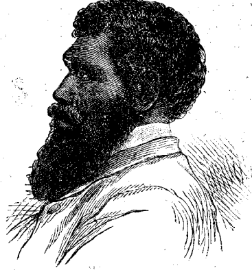
ԲԱՆԱԲԱՆՔԵԱԿ ԱՄՍՏՐԱԼԻԱՅԻՔ, ԱՅՐ ԵՒ ԿՆՆ

հիմա հաւանականապէս 50,000 է պահաս է անոնց թիւը, մինչ սպիտակք աճած և հասած են դրեթէ 4,000,000ի: Զանքեր եղած են Աւստրալիոյ բնիկները Բրիտանեութեան դարձունելու քաղաքակրթելու, և այս ջանքերը պարտապէրած չեն: Երկրորդ պատկերը կը ներկայացունէ բնիկ Աւստրալիացի քաղաքակրթեալ այր մը և կին մը: Երկար ժամանակէ հետև քաղաքակրթութեան օրհնութիւնը վայելող ցեղերուն մէջ սովորաբար կ'ինն աւելի գեղեցիկ է քան այլը, բայց բանը այսպէս չէ վայրենեաց սերունդին համար,