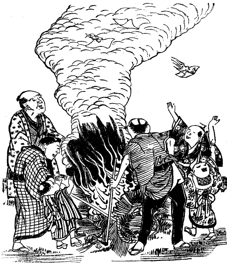
ՏԱՐԻՔԻՆԱԿ ՍՈՎՈՐՈՒԹՅՈՒՆ ՃԱՐՏՆԻ ՄԵՃ

Աղջիկն ըրաւ իւր պարզ պատմութիւնը : Մր. Լինքըն լսեց մտադրութեամբ, և ժպտելով հարցուց . «Բայց, սիրելիս, ես ի՞նչպէս գիտնամ թէ շիտակ է պատմածդ» : «Պրն. Նախագահ», պատասխանեց աղջիկը եռանդով, «իմ խօսքս իբրև երախտարութիւն ընդունելու ես» : «Կ'ընդունիմ», ըսաւ Նախագահը, տեղէն ել-