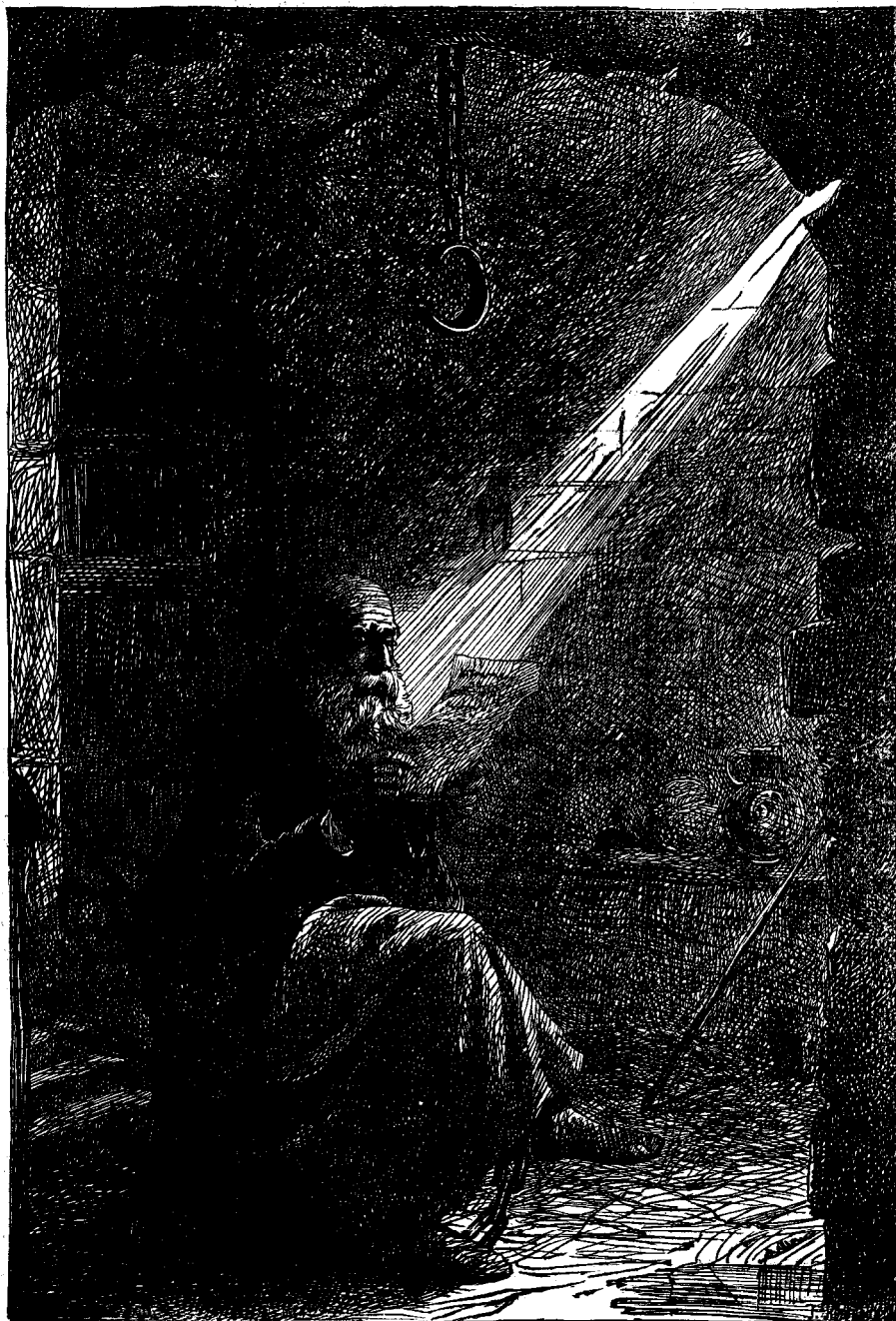
ՃՈՆ ՀՈՒՍ ՍՏՈՐԻԳՐԱՍ ԲԱՆՏԻՆ ՄԻՋ