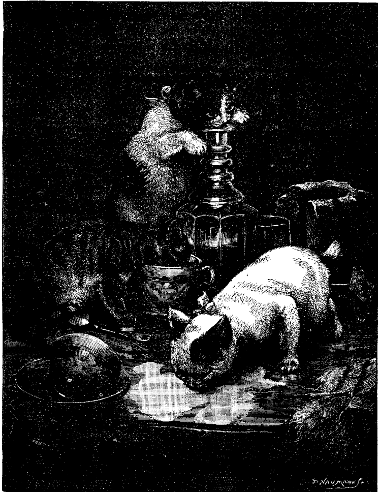
ՁԱՐԻՔ ԳՈՐԾՈՂ ԿԱՏՈՒԻ ՁԱԳԵՐ

Երբեմն մարդիկ կ'աղօթեն առանց նպատակի, և շատ անգամ առանց ար-