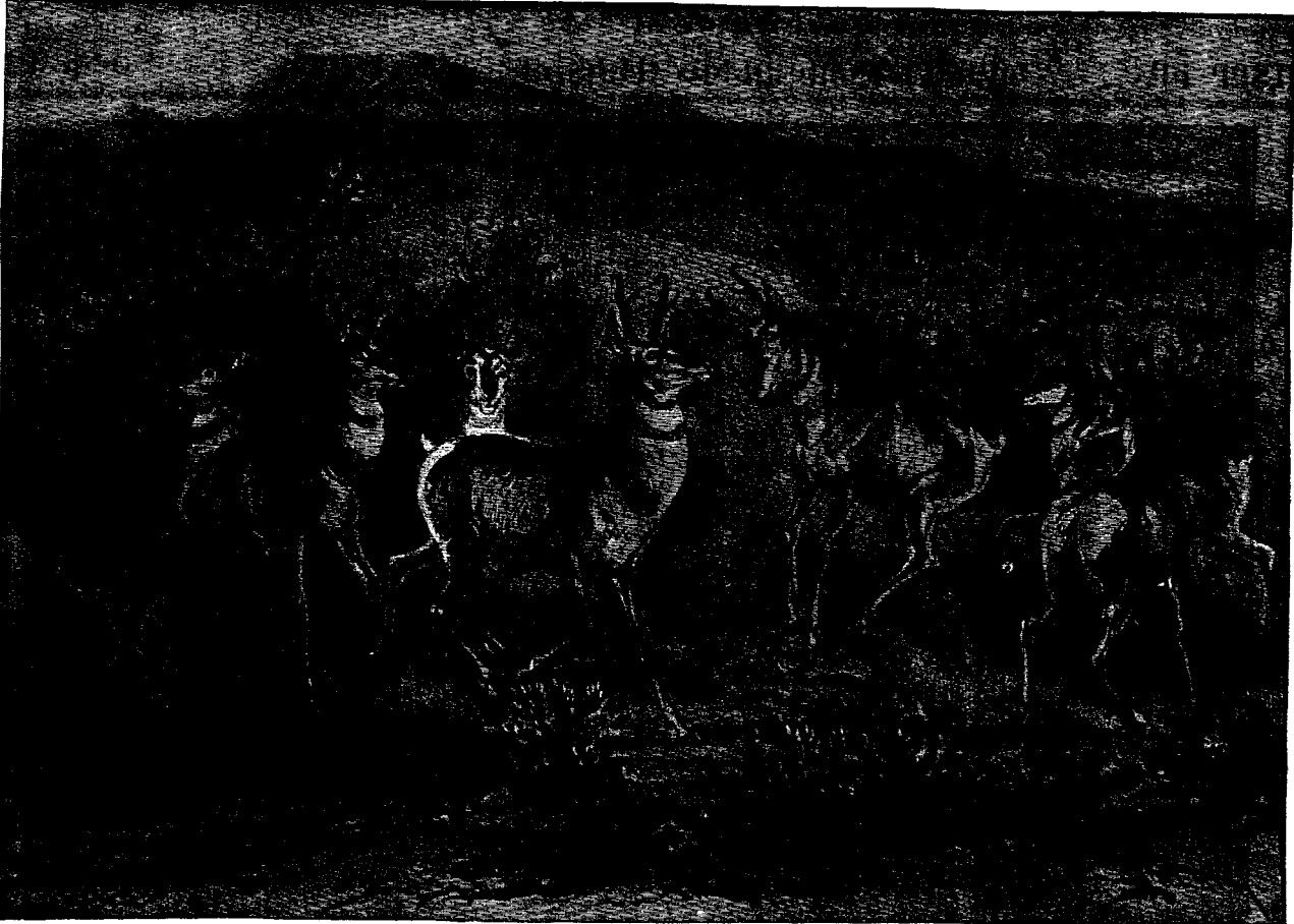
ԱՅՆՆԱՄԱՆԵՐԸ ԿԸ ՍՊԱՆՆԵՆ ԲՈՅՈՒՄԱՆՈՐ ՕՁ ՄԸ

կը կոչուի Բոժոժաւոր օձ, վասն զի ձայն մը կը հանէ ազիտի իւր զոհին վրայ յարձակելէ առաջ: Եթէ այս օձերէն մին խոյթ էր այժեամբ մը, հաւանականապէս կը մեռնէր սա: Բայց այժեամբերն առիթ չեն տար անոր: Երբ կը դրանեն բոժոժաւոր օձ մը, կը վազվազեն անոր շուրջը բոլորով մը ձեւացունելով, և օձը շուարելով իւր վրայ յարձակողաց բազումներէն և անոնց արագ շարժումէն, չգիտեր թէ ո՞ր կողմ