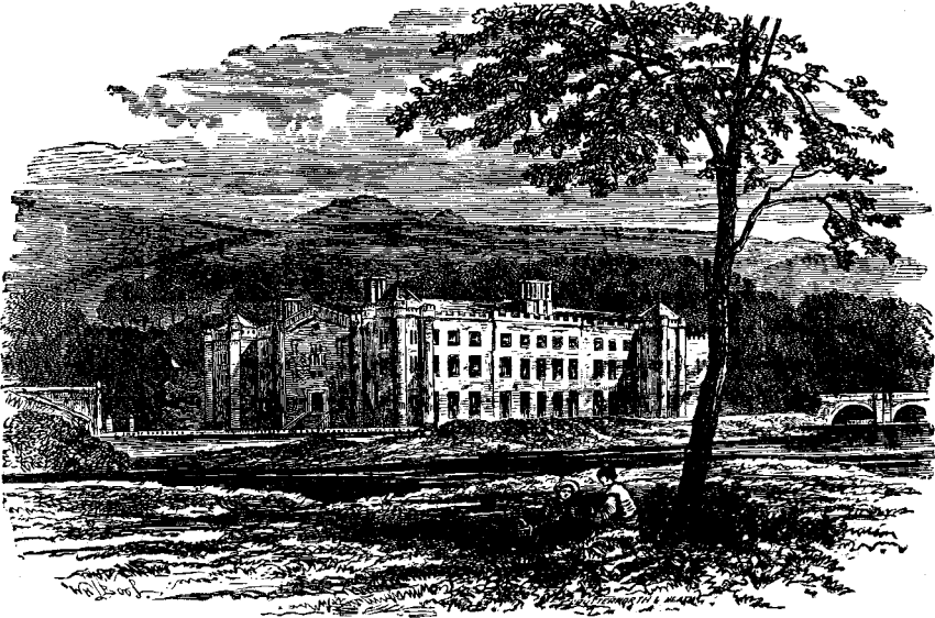
ՄԻՔ ՄԱՍԱՐԻՆԻ ԴՂԵԱԿ ԵՒ ՏՆԱԿ

նի մը վայրկենէն տղան եկաւ, ետ բերելով ստակին մնացորդը : Տոքթորն ըսաւ, «Այդ ստակը քուկը թող ըլլայ» : Բայց տղան չուզեց ետ առնուլ զայն, ըսելով թէ իւր հայրը պիտի յանդէմանէր զինք : Փոքրիկ տղայի մը վրայ տեսնուած այսպիսի հաղուագիւտ բնաւորութիւնը գրաւեց տոքթորին ու շագրութիւնը, և ասոր վրայ սկսաւ նա խնամով քննել տղան : Յայտնի կ'ըլլէր թէ աղքատ էր նա. անոր փոքրիկ վերարկուն պատառատուն էր և կարկատուած՝ գրեթէ ամէն տեսակ կը տաւներով, և իւր տարատը (խոփալ) այնքան գոյներ ստացած էր, որ դժուարին էր ըսել թէ ինչ էր անոր նախնական գոյնը, բայց յոյժ վայելուչ էր և մաքուր : Տղան հանդար-