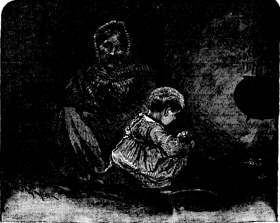
ԻՊԱՆՏԱԿԱՆ ՏՆԱԿԻ ՄԸ ԵՆՐԻՆ ԿՈՒՐԸ

մը նստած լրագիր կը կարդար, «մեծ հայր, ես այսօր եօթը տարեկան եղայ, կարճ տարատ պիտի հազնիմ և պիտի սկսիմ գպրոց երթալ:» «Ինչո՞ւ, ինչո՞ւ:» ըսաւ ծերունին, լրագիրը վար դնելով, «այս ո՞րչափ բաներ մէկտեղ պատահած են:» Մեծ հայրը գրեթէ այնչափ հեռի կը գտնուէր իւր կենաց վախճանէն որչափ Ֆրից՝ իւր կենաց սկիզբէն, և մեծ տարբերութիւն կը տեսնուէր մէկուն ծնած մարմնոյն, ճերմակ գլխուն և տկար շարժուածքին և միւսին փայլուն պայծառ դանդաղ ներուն մէջտեղ որ կը շարժէին և կը