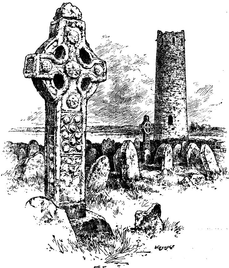
ԱՇՏԱՐԱԿ ԵՒ ԽԱՉԵՐ Ի ՔԼՈՆՄԱՔՆՈՅՍ, ՅՈՒԼԱՆՏԱ

Շերունի պատկերահան մը դիտելով փոքրիկ տղայ մը որ կը զբօսնուր նկարներ շինելով իւր ներկամանը, վրձինները, եռոտանին (բեռնաբեռ) և նստարանը գործածելով, ըսաւ, «Այդ