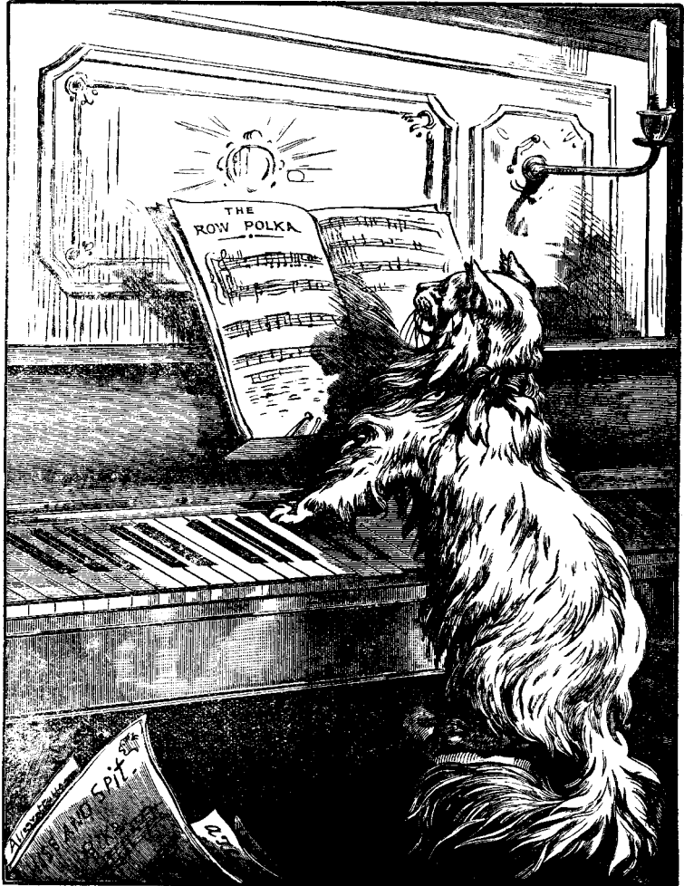
ԵՐԱԺԻՇՏ ԿԱՏՈՒ ՄԸ

Էտիսընի նոյն իսկ անունը կը յիշեցունէ երեկտրականութիւն: Նա ար-