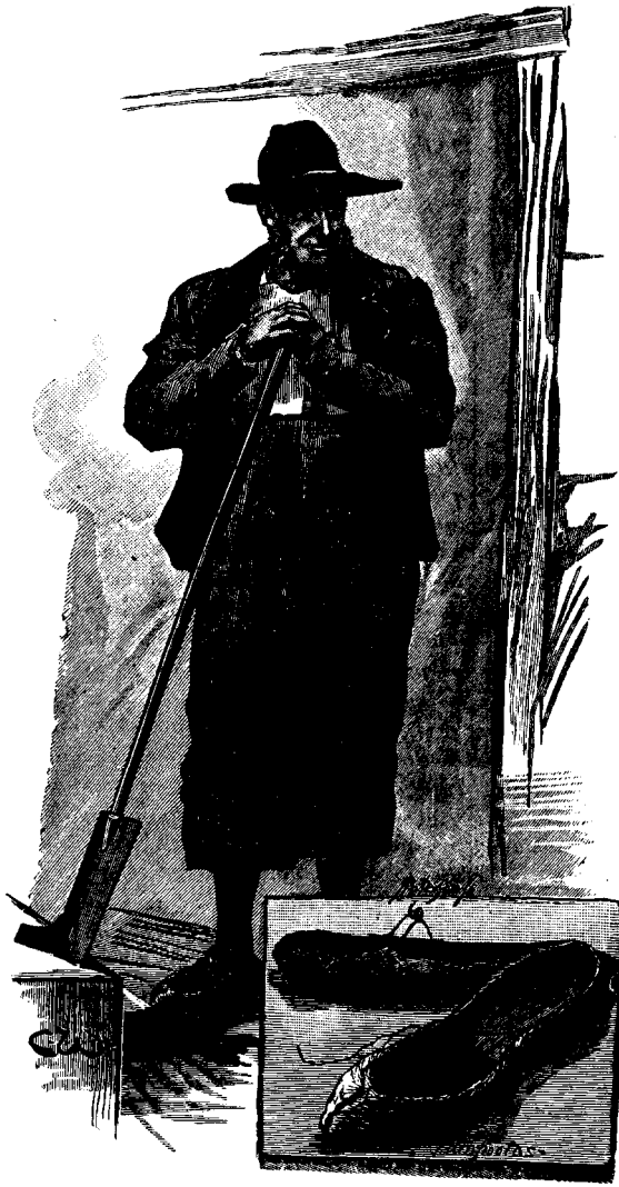
ԱՐԸՆ ԿՂՁԻՈՑ ԲՆԱԿԻՉ ՄԸ

Տղայոց Աւետարեւրի Մայիսի Թուոյն մէջ դրինք պատկեր մը Կոնստանտնուպոլսի կողմէն զոր կը գործածեն իւրանտայի կարուէյ Գոյի կղզեցիք: Հոս մեր առջև կը տեսնենք այդ կղզեաց բնիկներէն միոյն պատկերը: Նայեցէք, անոր արեւմտեան (աւել) կարծես չինուած են ֆիւրախտանի մէջ: Երբ վտանայ և Պաշտպալայի մէջտեղ ձիւնապատ լեռներու վրայ քայլելով հինցան մեր կողմիցները և կը ցաւոունէին մեր գարշապարները, բարեկամ գիւղացիէ մը գնեցինք զոյգ մը արեւս տանց նման, և կը փափաքէինք որ զայնս հագած ընէինք մեր ճանապարհորդութիւնը: