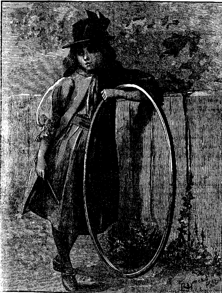
ՇՐՋԱՆԱԿ ԳՂՈՐՈՂ ԱՂՋԻԿ

(«Ինչպէս») են որ արջառք չեն կրնար արածիլ անոնց վրայ. և այս փոքրիկ խոտի դաշտերն են ուր կանայք չոր խոտ կը պատրաստեն ամառուան եր- կայն օրերուն մէջ: Կառք չկրնար ելլել այդ տեղերը՝ եթէ ուզուէր իսկ կառք գործածել, և ուստի հարկ է որ խոտը ահագին խուրձերով վար իջուցնեն այդ մարդիկ իրենց զօրաւոր ուսերուն վրայ առած զայն. նաև հարկ է ունենալ ուժեղ գլուխ և հաստատուն ոտք որ