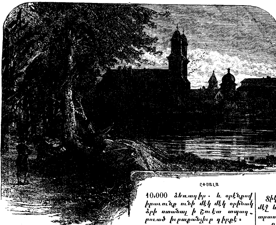
Բ Փ Ս Ա Լ Ա

Յոննիկ երբեմն կ'երթար իւր մօր և կ'ըսէր, «Կ'աղաչեմ, մայրիկ, սա երկաթ կոշիկն հանէ ոտքես: Շատ դժուար է զայն գործածել, գրեթէ կը մեռցունէ զիս: Ես հոգ չեմ ընէր եթէ կաղ ըլլամ, հոգ չեմ ընէր եթէ սաքիս կոճը դուրս անկուի, հոգ չեմ ընէր թէ ինչպէս պիտի ըլլամ երբ մեծնամ. բոլոր փափաքս այն է որ սա կոշիկն հանես ոտքես:» Յոննիկ շատ նշողութիւն կու տար իւր մօր և կը ձանձրացունէր զնա իւր սուրտունջներով, իբր թէ մայրը այդ կոշիկը անոր ոտքն անցուցած ըլլար զնա չարչարելու համար: Բայց այդպէս չէր բանը: Երկաթ կոշիկը անհրաժեշտ էր տղային սրունքը հաստատ պահելու համար, մինչև որ ոսկրները զօրանային և առողջանային: Բայց Յոննիկ հաւատք չունէր այդ մասին: Չէր համոզուած թէ այդ կոշիկը որ և իցէ օգուտ պիտի ընէր իւր սաքին: Փոխանակ վատահելու իւր մօր և բժշկին՝ ամէն ժամանակ կը գտնուէր և գլուխ կը ցուցունէր: