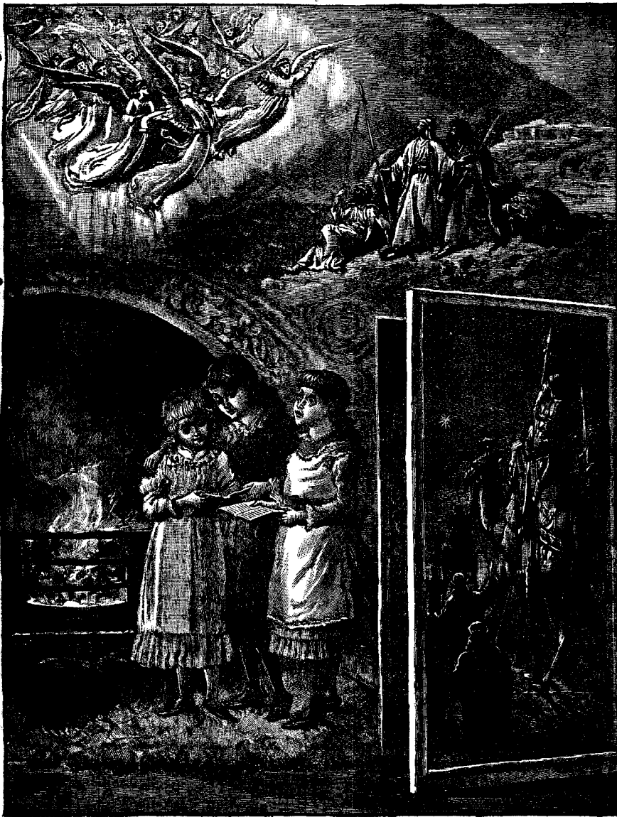
ԵՆՆԻՅԱՆ ՏՈՒՔ ԵՐԳԻՆԵՐ