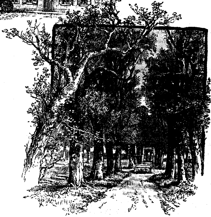
ՀԵՐՆՀՈՒԹԻ ՄԵՆ ԳԵՐԱՄԱՆ

բակաց ննջարան մը և ճաշարան մը : Վարի պատկերին մէջ կը տեսնուի գերեզման մը որուն մէջտեղի ծառ- ուղիին մէկ կողմը կը թաղուին այր մարդիկ, և միւս կողմը կին մարդիկ, և մեռելներուն վրայ կան հաւասար մե- ծութեամբ պարզ, սափակ քարեր : Մորավեաններուն ամենէն մեծ արժա- նիքն է իրենց միսիոնարական մեծ գոր- ծունէութիւնը : Թէև փոքր մարմին մըն են, սակայն 1732էն ի վեր աշխարհի այլ և այլ կողմերը զրկած են 2,300 միսիոնար, և միսիոնարական դաշտե- լու մէջ հիմա անոնց ունեցած մարդե- լուն և կիներուն թիւն է իբր 300 :