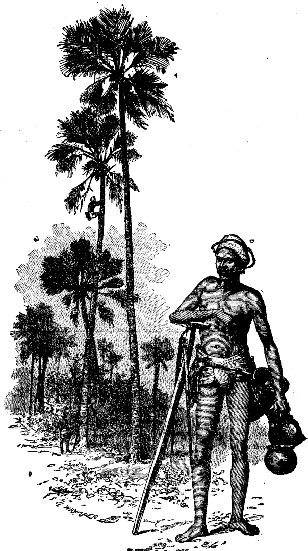
ԱՐՄԱՒԵՆԻ ՎՐԱՅ ԵՂՈՂԸ

Արմաւենիի մէկ տեսակը, որ Հընդկաստան կը բուսնի, անուշ հիւթ մը կու տայ որմէ շաքար կը յինուի: Հիւթը կը վազէ ծաղիկները կրող կոթէն որ կը բուսնի՝ կայմի նման և առանց ճիւղի բունին դազաթը, և հիւթը ժողովելու համար օրը երկու անգամ ծառին վրայ ելլելու է: Ծառը ելլողը պարտի ունենալ մեծ ոյժ ու զգուշաւորութիւն, և ընելու է յարատե վարժութիւն: Հիւթը ձեռք բերելու համար գործածուած ամանները, դանակը, և փայտէ ազգանները՝ (կէրտի) մէջքի հանդերձին կը կապուին, որովհետեւ ձեռքերը պէտք են ծառը ելլելու համար: Ծառը ելլողին կինը լաւ մը կ'եռացնէ հիւթը և կը յինէ շաքար զոր չուկայ կը տանի ծախելու: