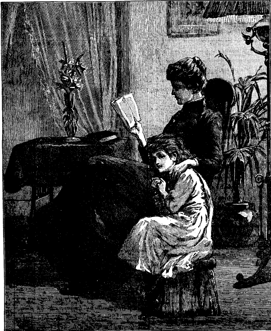
ԿԻՐԱԿԻ ՕՐՈՒԱՆ ԵԱՐՄԱՐ ՊԱՏՄՈՒԹԻՒՆ ՄԸ

Մեծ իմաստութիւն կը պահանջուի քրիստոնէայ ճնողներէ Տէրոջը օրուան մէջ իրենց զաւակաց ինամ տանելու մասին: Սխալ ընթացք է մէկ կողմէն տղան ստիպել այնքան զգուշութեամբ ու խստութեամբ պահելու այդ օրը որ ատէ զայն, և միւս կողմէն զայն ուրիշ օրերու նման համարիլ տալ անոր Տղայք չեն կրնար մէկն եօթներորդ օր թողուլ իրենց աղայական բնութիւնը: Մարմնական մարզանքի և զբօսանքի կը կարօտին. սակայն այն զօսանքները որք անոնց թոյլ տրուելու են իրակի օրերը՝ կրնան այնպիսի բնութիւն ունենալ որ տղայոց մտքին վրայ տպաւորեն թէ այդ օրը սուրբ օր է: Աստուածաշունչը տղայոց ծանօթացնող խաղեր, երգեցողութիւն և օգտակար ու շահեկան գրքերու ընթերցումը ամենէն սովորական միջոցներն են իրակին փոքրիկներուն համար սիրելի օր մը ընելու: Հայրը կամ մայրը տղոց հոգևոր զարգացումը այնքան կարևոր համարելու են որ պատրաստ ըլլան զանոնք բարոյապէս կրթելու և օգտակար կերպով զուարճացնելու նուիրել սուրբ օրուան մէկ մասը զոր պիտի փափաքէին ուրիշ կերպով անցընել: Այս պատկերին մէջ տեսնուող մայրը իր փոքրիկ աղջկան կը կարգայ իրակի օրուան յարմար պատմութիւն մը: