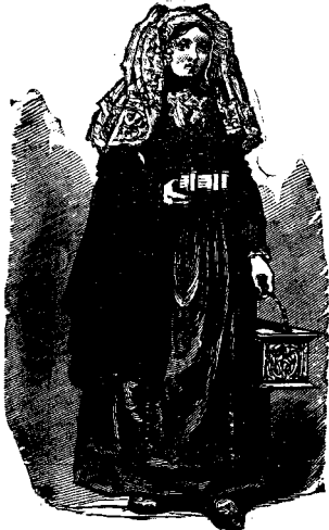
ԵԿԵՂԵՑԻ ԳԱՅՈՂ ԶԵԼԱՆՏԱՅԻ ՏԻԿԻՆ

ղիներէ : Պատկերը կը ներկայացունէ Չբանտացի տիկին մը որ եկեղեցի կ'երթայ : Անոր տարօրինակ գլխանոցը և գօտին լայն ճարմանդը (քոֆա) ու- չադրութեան արժանի բաներն են իւր զգեստին վրայ . բայց ի՞նչ է ձե- ռաց մէջ կրածը : Փոքր արկղ մը հաւա- նականապէս ծակծկուած պղինձէ , որոյ մէջ կը դրուի ամանով կրակ ոտուրները տաք պահելու համար եկեղեցւոյ պաշ- տաման միջոցին : Այսպիսի «ոտից ջեր- մոցներ» հասարակ էին Ամերիկայի մէջ իմ մանկութեան ատենը : Ժողովրդէն ոմանք կառքերով կու գային հինգ մը- ղոն հեռաւորութենէ , և այս ոտից ջերմոցները անոնց ոտուրները տաքուկ կը պահէին թէ՛ ճամբան և թէ՛ եկե- ղեցւոյ մէջ : Սուաւօտու և կէս օրէն ետքի պաշտամանց մէջտեղ տիկնայք