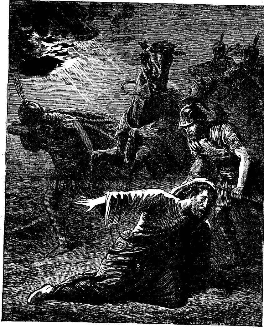
ՍՈՒՐԲ ՊՕՂՈՍ ԴԱՐՁՍԵԱՍԻ ԶՄԵՐՈՒՆ ԿՐՈՑ

Մր. Հ. Մ. Ուստ, Երիցական պաշտօնեայն ի Չինաստան, կ'ըսէ թէ մարդու սիրտը կտոր կտոր կ'ըլլայ տեսնելով հեթանոսութեան թշուառութիւնը զոր հնար չէ բերնով պատմել : Խօսած է մօտերս Չինաստանի քաղաքներէն միոյն մէջ բնակող երիտասարդի մը անձնասպանութեան վրայ : Երիտասարդին մարմինը գտնուեցաւ դետին մէջէն, հանդերձները՝ գետեղերէն, որոց վրայ գնդապետով փակցուած էր գրուած մը սա իմաստով : «Իս յուսահատած եմ երբեք սրտի խաղաղութիւն կամ հանգստութիւն գտնելէ . կանուխ զգացի թէ մեղաւոր էի, և ըսին ինձ թէ քուրմի մը պարտականութիւնները կատարելով տաճարներէն միոյն մէջ, գօ՛հ պիտի ըլլայի և հանդարտէի : Փորձեցի բայց չյաջողեցայ : Իմ բոլոր ստացուածքէն հրաժարեցայ և թախառեցայ տեղէ տեղ, խոնարհեցնելով անձս և ստրալով իմ օրական հացս : Գաջեցի անօթութիւն, ծարաւ, ցուրտ և կարսութիւն : Բայց բոլորն ալ ի գո՛ր» :