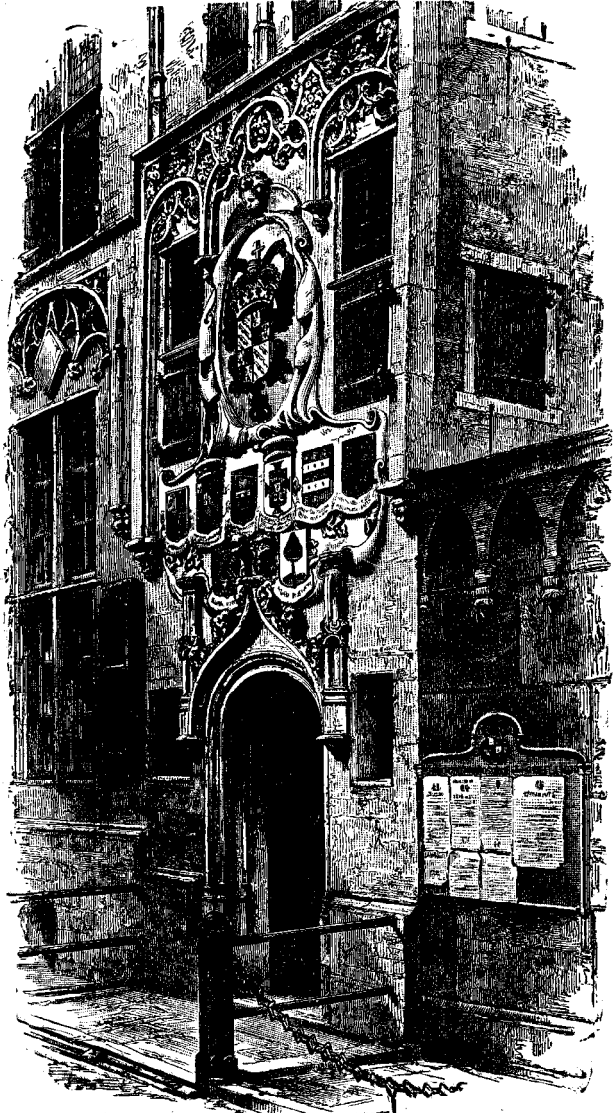
ՕՐԱՆՅԱՆՑ ԱՐԼԷԻՄ ԻՇԽԱՆԻ ԵՊԱՐԱՆՈՒ ՄԵՃ ՄԱՍԸ

Հայնրիխի բարեկամները այդ երե- կոյ ճամբայ կը նայէին անոր ի Լէննէփ