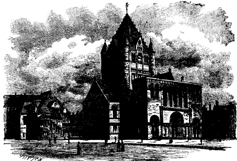
ԵՐԿՈՒ ԵԿԵՂԵՑՆԵՐ ՊՈՍԹՐԵՆԻ ՄԷՋ

Երկրորդ եկեղեցին , որ շինուեցաւ 1729 ին , տակաւին կը կենայ , բայց ա՛լ չգործածուիր իբրև եկեղեցի : Ժամանակ մը կառավարութիւնը վարձեց զայն , բայց հիմա վերածուած է պատմական թանգարանի մը ուր կը պահուին Նոր Անգլիոյ (Միացեալ Նահանգաց հիւսիսային արևելեան մասը) պատմութեան առաջին տարիներուն յատուկ հրատարակումներ : Պատկերին մէջի սիրուն եկեղեցին շինուեցաւ իբր 20 տարի առաջ , և միւս շէնքէն զա-