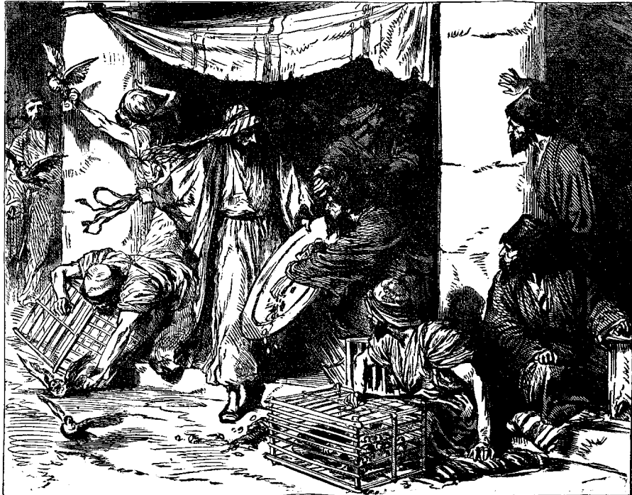
«ՄԵՆԸ ՏԱՃԱՐԷ ԴՈՒՐ ՉԱՆՑ»

Բաւ աղաւնի ծախողներուն, «Ասկէ վերցուցէք ատոնք:» Յրուուած ստակը կրնային ժողովել, դուրս հանուած ոչխարները և արջառները կըրնային նորէն ձեռք անցընել անոնց տէրերը, բայց եթէ աղաւնիներն արծակէր, դժուար պիտի ըլլար դանոնք նորէն բռնել. թէև պատկերը այս մասին սխալ կը ներկայացնէ իրողութիւնը: Մեր Տէրը ինչ հողածութեամբ ցուցուց իր տհաճութիւնը մեղքին դէմ՝ առանց ստացուածքի կորուստ յառաջ բերելու: «Իմ Հօրս տունը առուտուրի տուն մի ընէք:» Չարմանալի է որ ո՛չ քահանայ և ո՛չ փաճառական բնդդիմութիւն ըրին Քրիստոսի: Ո՛վ կրնայ կայնիկ երբ անիկա երևնայ: Յանցաւոր խիղճը չկրնար: