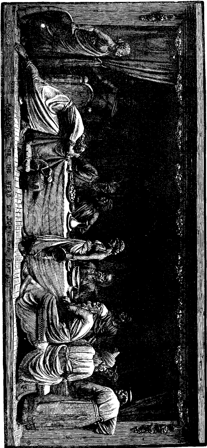
ՅՈՎՀԱՆՆԵՍ ՄԿՐՏՁԻ ԳԼԻԱՏՈՒՄԸ

գիայի, սրտին մէջ կը թուի թէ բարի բան մը չկար : Հերովդիա երբեք ապաշխարութեան չարթեցաւ, բայց միայն անգութ և տնհայտ ատելութեան : Անոր սիրտը ինչպէս դառնա-