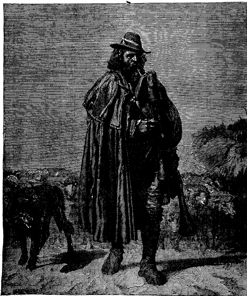
ՀՈՎԻՒՆ ԻՆՍՏՐԱՆՍ ԳՐԱՅ

Թեան կարօտ, վասն զի շատ սկար և անզօր են: Քրիստոս զիտէր այս բանը երբ խօսեցաւ կորսուած ոչխարը փնտռելու վրայով, որուն համար հովիւը ամբողջ հօտը կը թողու և բլուրներուն վըրայ կը պտրտի: