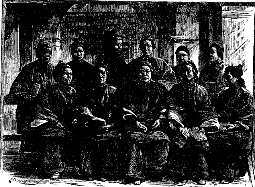
ԱՅՈՑ ԱՍՏՈՒԾԱՇՈՒՆՅ ԿԱՐԳԱՅՈՂՆԵՐՈՒ ԽՈՒՄԲ ՄԸ

Փոքր աղջիկ մը տեսնելով որ իրենց սպասաւորը հացի փշրանքները կրակը կը նետէ, “Չե՛ս գիտեր որ Աստուած հոգ կը տանի ճնճողիներուն,” ըսաւ: “Եթէ Աստուած անոնց հոգ կը տանի, մենք պէտք չէ որ մեզ նեղենք անոնց համար,” պատասխանեց սպասաւորն անհոգութեամբ: “Բայց,” ըսաւ փոքր աղջիկը, “ես աւելի կ’ուզեմ Աստուծոյ նմանիլ, և հոգ տանիլ փոքրիկ թըռչուններուն՝ քան ցրուել կամ պարագ տեղը վատնել մեզի տուած ուսելիքը:”