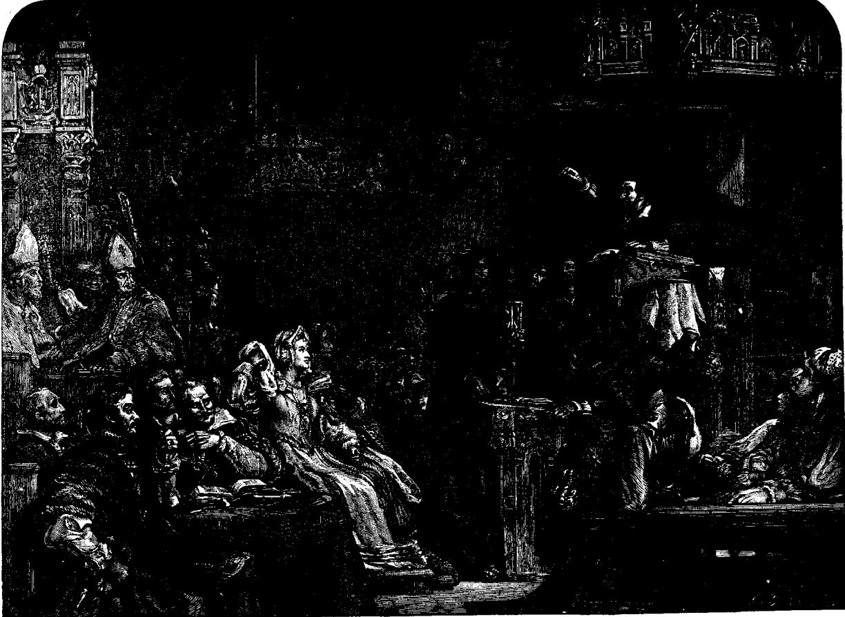
ՃՈՆ ՆՈՔՍ ԿԸ ՔԱՌՈՋԷ ԺՈՂՈՎՐԴԻՆ ԵՐԵՒԵԼԻՆԵՐՈՒՆ ԱՌՋՆԻ

համալսարանին փրոֆէսորները, կանոնիկոսներ և արեղաներ, և իր ժամանակի նշանաւոր լրբերէն և տիկիներէն շատը: Եւ սակայն ինք Աւետարանին ճշմարտութիւնները կը հրատարակէր իր բոլոր աշխոյժովը, մի և նոյն ժամանակ գիտնալով թէ ճշմարտութիւնը իր հասկցածին պէս բացատրելով դառն հակառակութիւն կը յարուցանէր իրեն դէմ: Այս բաներէն անմիջապէս ետքը Սբ. Անդրէասի ամբողջ առնուեցաւ Գաղղիական նաւատորմի մը ձեռքով և ճոն Նոքս գերի բռնուեցաւ: Գաղղիացոց