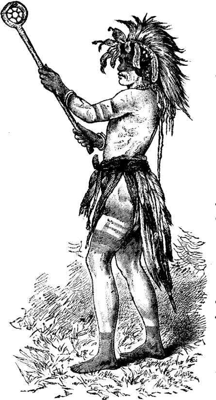
ԱՄԵՐԻԿԵԱՆ ՀՆՌԿԱՅ ԼԷՔՐՈՍ ԽԱՂԸ

չողացին հաճելի պատկերներ, հաճելի կեակատար խորհուրդներ, և նոյն ժամանակ սկսաւ որոճալ, ինչպէս մշտ կ'ընեն կովերը երբ հանգստութիւն կը զգան: Եւ ահա կաթին դոյրը հետզհետէ լեցուեցաւ և դոյլին բերնին մօտեցաւ մէջի կաթը, ինչպէս ըսուած ձայնէն ալ կը հասկցուէր: Բայց Գրիստինէի գործունեայ մատերը տակաւին կը շարունակէին իրենց աշխատութիւնը: Վերջին երգը լնցաւ երբ վերջին կաթիլը թափեցաւ դոյլին մէջ, և Գրիստինէ մնաս բարևի մեղմ հարուած մը տալով կենդանիին մետաքսեայ պարանոցին, և «Երեղ կով» ըսելով անոր թաւամազ ականջին մէջ, ելաւ յաղթանակով և իր քայլերը դէպ ի խոհանոց ուղղեց: