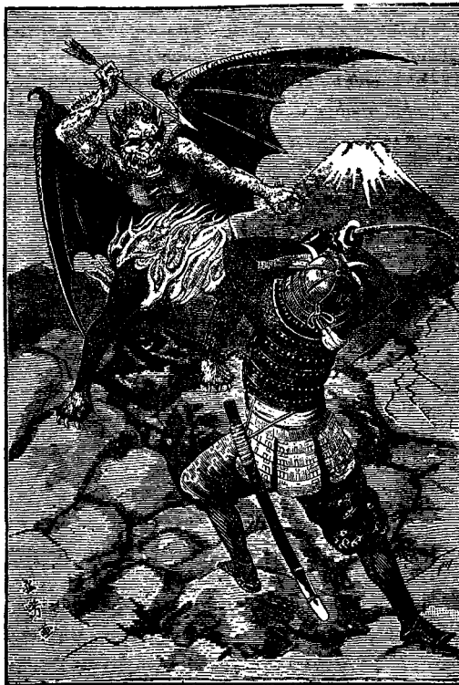
聖の基督と魔道徒

Կարդացած էք քրիստիանոսի ճամբորդութիւնը: Եթէ կարդացած չէք, պէտք է որ կարդաք, կամ եթէ շատ պզտիկ էք և չէք կրնար կարդալ, պէտք է որ մէկուն կարդալ տաք և լսէք: Պիտի չհասկնաք անոր բոլոր հոգեւոր նշանակութիւնը, բայց իբրև պատմութիւն շատ հետաքրքրական պիտի գտնէք զանիկա: Այն գիրքը թարգմանուած է թէ՛ Հայերէնի թէ՛ թուրքերէնի նաև ուրիշ շատ լեզուներու: Այս պատկերը առնուած է ճափոներէն թարգմանութենէն: Կը ներկայացնէ քրիստիանոսը որ կը կռուի չար դէմին, Ապոլոնի, հետ, և որ կ'երևնայ հին օրերու ճափոնցի զինուորի զրահը հագած: