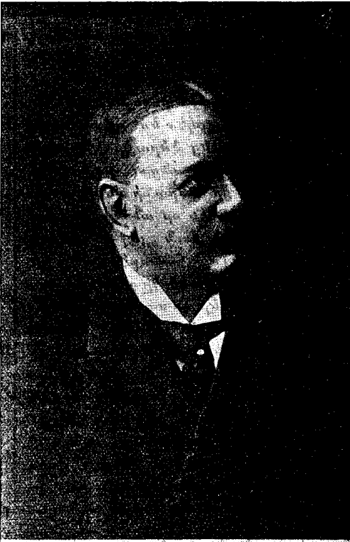
Bernhard von Bülow

«Օ՛ն, տղայ» «Օ՛ն, մարդ» պատասխանը եկաւ փայլակի արագութեամբ: