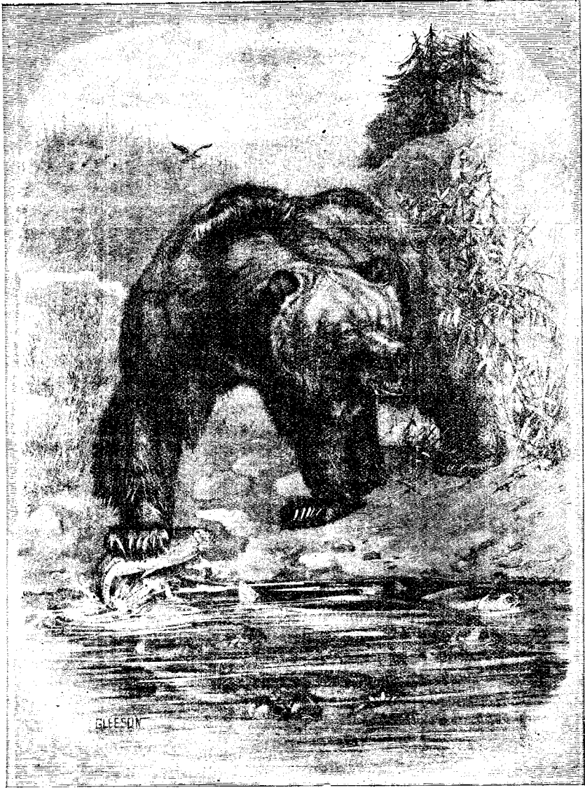
ՊԱՐԻՍԻՆ ԿԱՂԱՆԴԵՔԸ երկու փոքր տղաք, Պերճ և Հրանտ:

որ մը խաղալու վրայ էին, երբ յանկարծ պարիկ (փէրի) մը երեցուտնոց ու ըսաւ. «Ես ձեզի մէյուկ կ'սպանցչէք տալու համար գրկուած