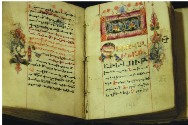
Ժողովածոյ ԺԷ դար Գրիչը եւ ծաղկողը՝ անյայտ